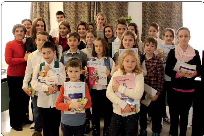
Najbolji kazivači ustanove školske godine 2015./16.