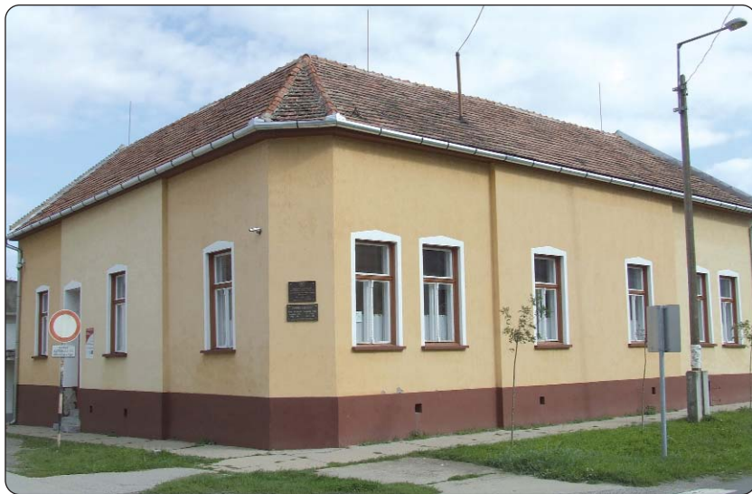
Nekadašnja zgrada bunjevačke škole, danas Zavičajnog muzeja

(bunjevačkohrvatske) škole obilježili smo u okviru priredbe Hrvatske narodnosne samouprave. Na dostojan je način organiziran susret bivših pedagoga i učenika. Lijep i dojmljiv bio je trenutak svečanosti kada je na nekadašnjoj zgradi AFS-a i „alma mater“ – danas Seoski muzej – otkrivena dvojezična spomen-ploča, kojoj je nazočilo stanovništvo sela. Svi su mogli uzeti za ovu prigodu pripremljeno „spomen-izdanje iz povijesti škole“ koje je sastavio autor ovih redaka.