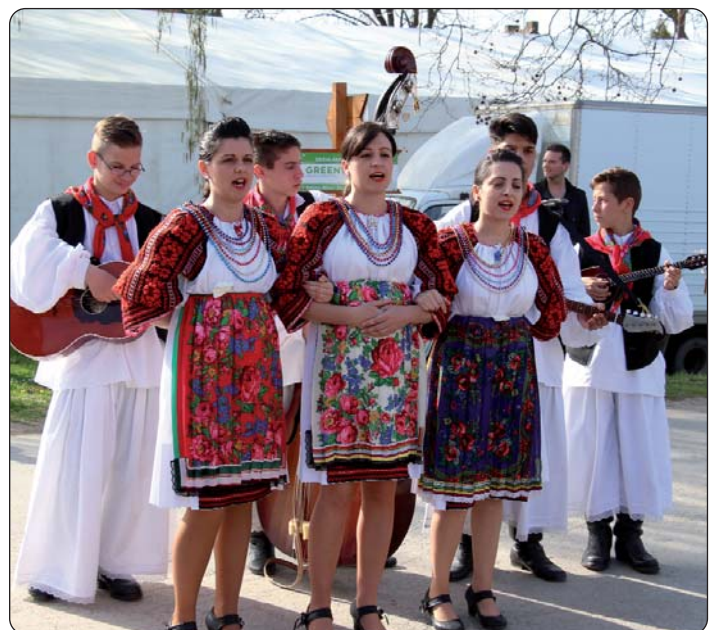
Starinski Tamburaški orkestar i zbor Biseri Drave