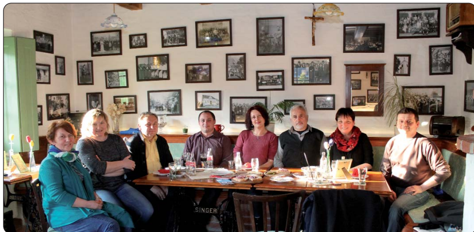
U kafiću „Nazdravlje“ u Petrovom Selu