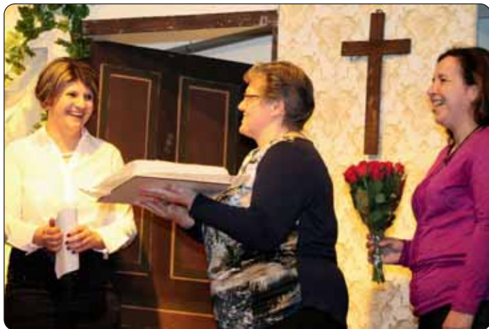
Čestitka bivših igrokazačev