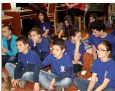
Santovo – školsko natjecanje