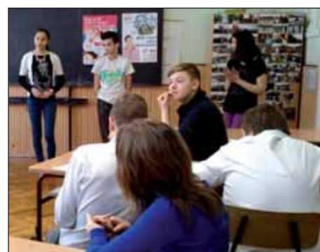
Iz martinačke škole