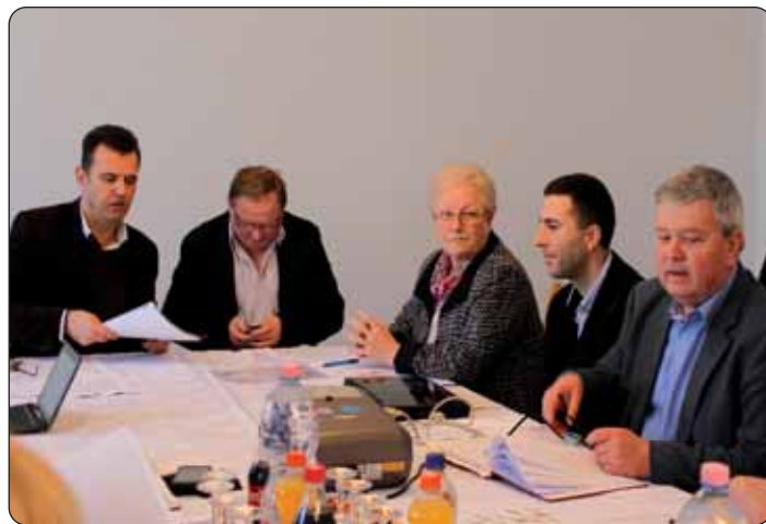
Predsjednik (slijeva prvi) pozdravlja članove EGTS-a.

Stjepan Tišler, supredsjednik u financijskom izvješću, naglasio je da organizacija prihode zasada ima samo od članarine iz čega je financirana i izradba strategije, međutim nadaju se da će ove godine moći prijaviti natječaje za djelovanje odnosno i za razne europske projekte. Na sjednicu je stigao i Tvrtko Čelan, program-