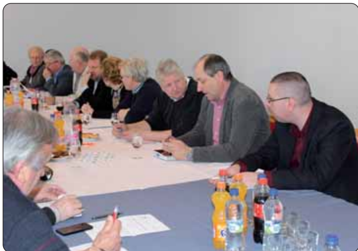
Načelnici pojedinih naselja

Europska grupacija teritorijalne suradnje Regija Mura utemeljena je lani u svibnju. Ciljevi su Grupacije jačanje gospodarske, socijalne i druge suradnje provedbom projekata i programa suradnje koje sufinancira Europski fond za regionalni razvoj. Na drugoj skupštini EGTS-a Regije Mura predsjednik Mario Moharić sažeo je aktivnosti organizacije tijekom godinu dana. Grupacija je na prvoj skupštini povjerila izradbu Strateškog plana EGTS-a Regije Mura Srednjoeuropskoj službi za prekogranične inicijative koja će biti dovršena do kraja ožujka. Radi izradbe provedene su ankete na tom području te je zatražena daljnja pomoć od predsta-