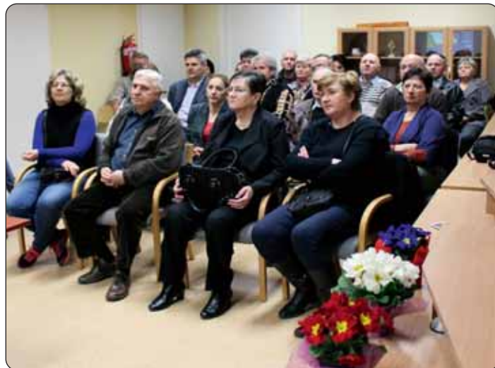
Brojna znatiželjna publika