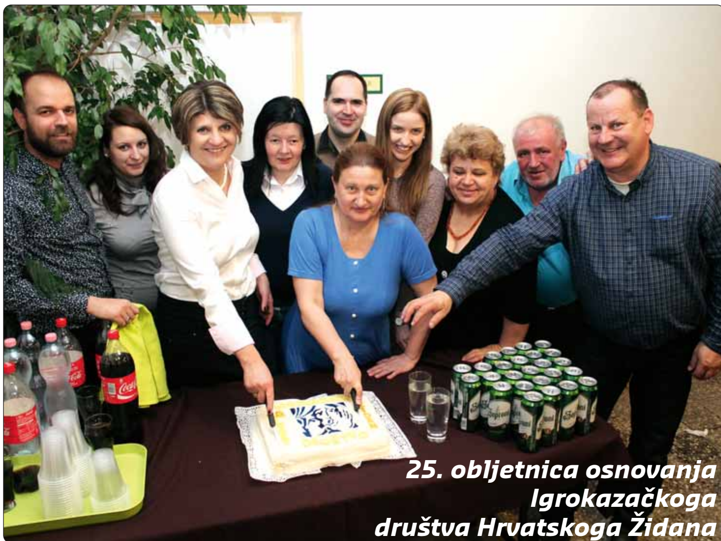
25. obljetnica osnivanja Igrokazačkoga društva Hrvatskoga Židana