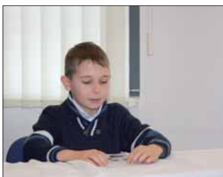
Mohač – županijsko natjecanje