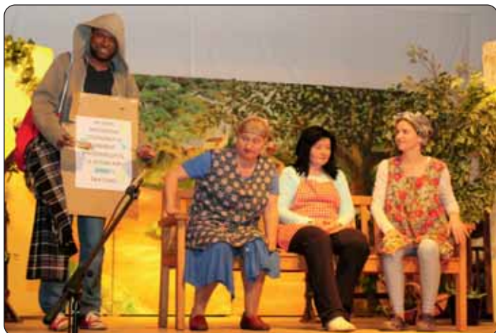
„Tri sveti kralji“ su zavridili burni aplauz.