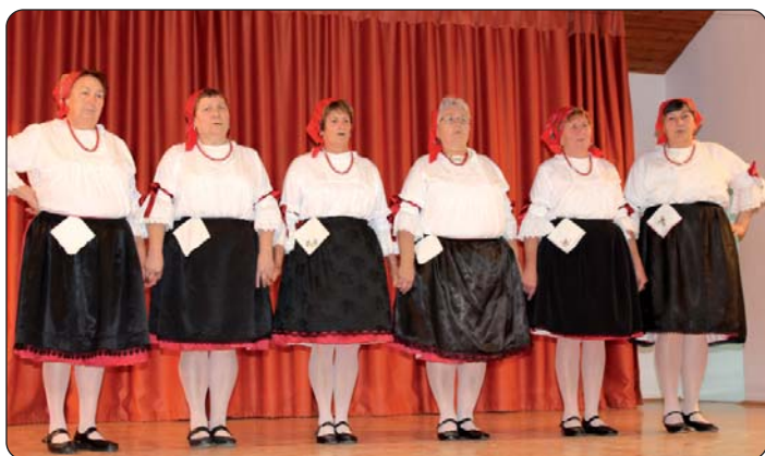
Pjevaju „Petripske ružice“.