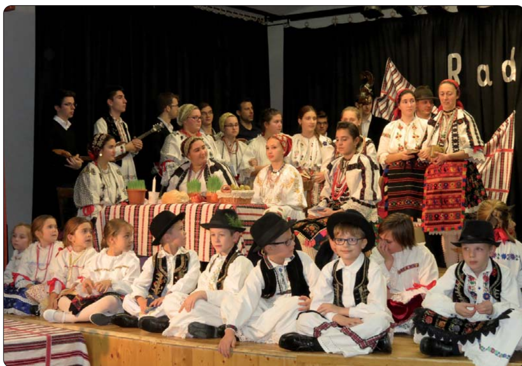
Božićni program dječje skupine KUD-a „Marica“