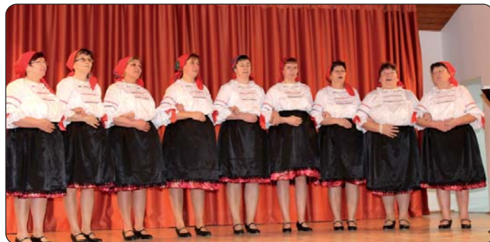
Pjevačice Zbora Biseri Pustare