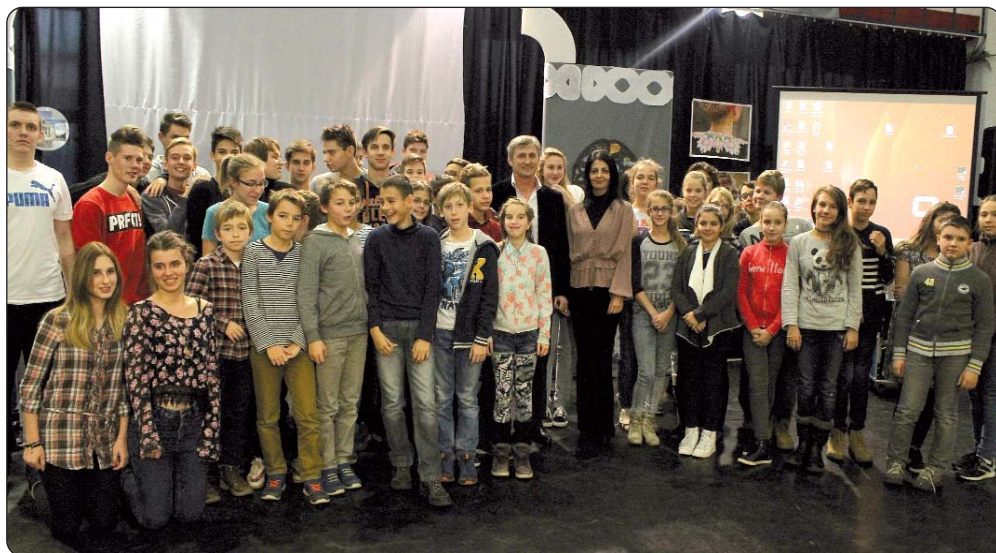
Hošigovci u društvu slavnoga hrvatskog nogometaša Roberta Jarnija

Dana 25. studenoga predstavljen je usporedni život dvojice književnih velikana, barda hrvatske književnosti Dragutina Tadijanovića i mađarskoga pjesnika, siromaha Attila Józsefa , a prijevode pojedinih njihovih pjesama na mađarski i hrvatski jezik