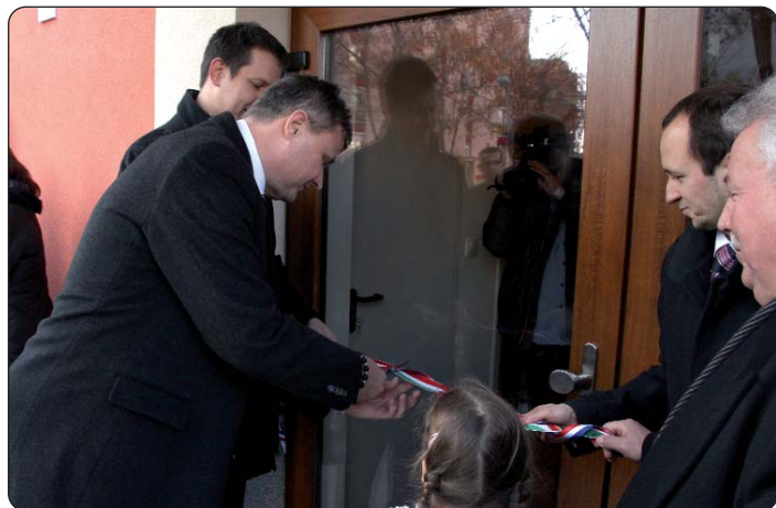
Svečani trenutak rezanja vrpce

Nakon više od godinu i nešto dana s mrtve točke počele su se gibati stvari glede izgradnje Hrvatskoga vrtića Prosvjetnog centra Miroslava Krleža u Pečuhu, pisali smo u siječnju 2015. godine. Tada su na pečuškoj gradskoj kući vođeni razgovori između triju