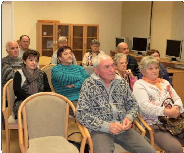
Okupilo se hrvatsko društvo.

Za ponedjeljak, 7. prosinca 2015., sazvana je javna tribina Hrvatske samouprave grada Šeljina koja je održana u tamošnjem Domu kulture „Ormánság”. Dnevni je red sastanka bio: informacije o radu Samouprave u 2015., planovi za iduću, 2016. godinu.