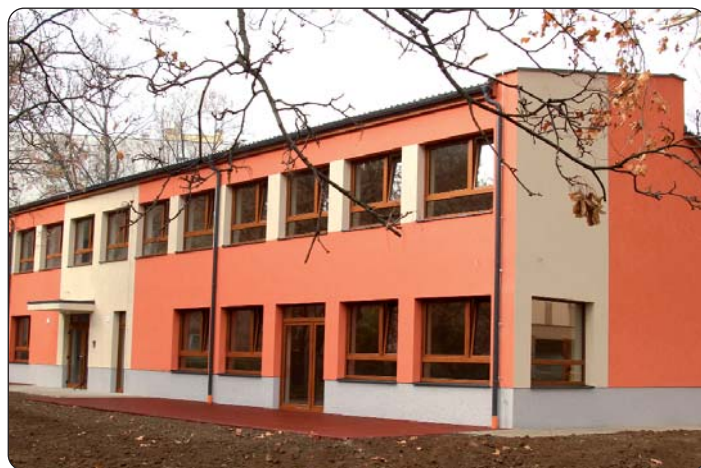
Velebno zdanje Hrvatskog vrtića