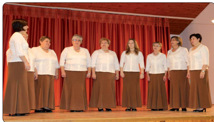
Sepetnički Veseli zbor