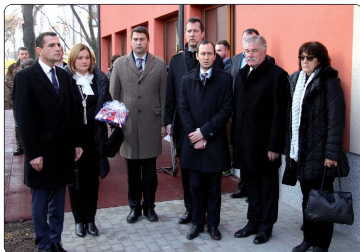
Dio brojnih uzvanika

Ignáca Acsádyja 8, gdje su boravili njezini štíćenici. U siječnju 2015. napokon su se složili s ponuđenim tehničkim rješenjima zgrade koju bi dobili kao zamjenu za svoju zgradu koju bi ustupili HDS-u, te su travnja, o. u.) počeli radovi na ponuđenome zamjenskom zdanju za njihove štíćenike koji su se do tada nalazili u zgradi pokraj Hrvatske škole, zgradi koju je HDS trebao dobiti, nakon njihova iseljenja u ponuđene (zgrada je bila u vlasništvu