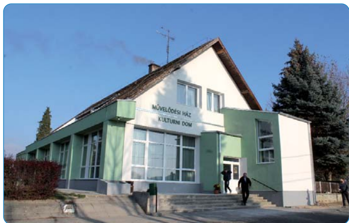
Kulturni dom u novom ruhu

Zelenkastobijelu novu pratež, a pod ruhom i počvršćenu obranu, izolaciju su dostali tri društveni objekti u Hrvatskom Židanu. Sad se i po vanjskom izgledu u velikoj harmoniji nalazu uz glavnu ulicu tri važne zgrade. Kulturni dom, jur pred petimi ljeti prikdan Dom zdravlja ter čuvarnica, a malo odaljeno još i Starački dom je bio dilnik onoga uspješnoga projekta, pomoću česa je Seoska samouprava mogla dati obnoviti čez rekordno vrime one ustanove ke u nje upravljanje pripadaju.