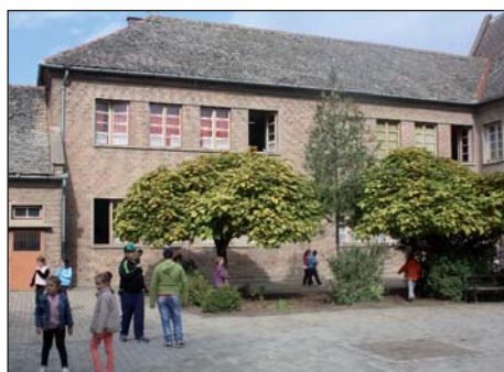
Nova školska godina na Fancagi