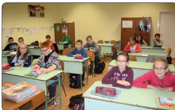
Najmlađi na satu hrvatskoga jezika i književnosti

bina i Baje u pripremi je i proširivanje veza s labinskom Osnovnom školom „Ivo Lolo Ribar“ razmjenu učenika. Dakako, ostat će i druge uobičajene priredbe poput Markova, a sve to ostvaruju i materijalnom i drugovrsnom potporom putem raznih natječaja, potporom Hrvatske samouprave grada Baje, Županijske hrvatske samouprave pa i Saveza Hrvata u Mađarskoj.