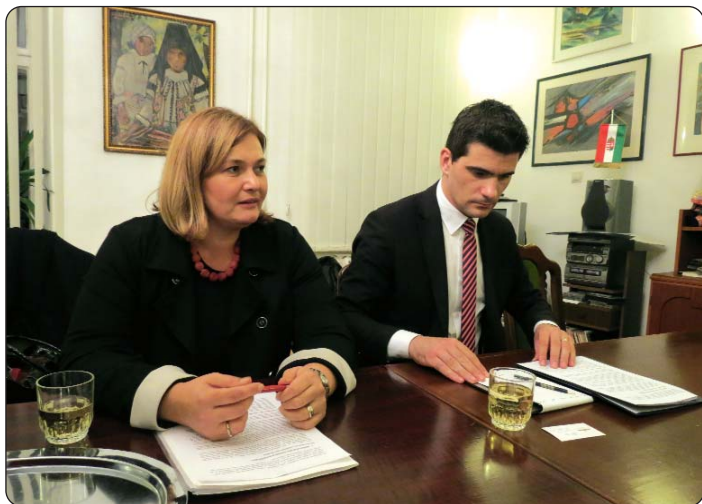
Generalna konzulica Vesna Haluga i zamjenik ministra kulture Republike Hrvatske Alen Kajmović u Hrvatskome klubu Augusta Šenoae

U službenom posjetu konzularnom području Generalnog konzulata Republike Hrvatske u Pečuhu, 14. listopada boravio je zamjenik ministra kulture Republike Hrvatske Alen Kajmović. On se u Hrvatskome klubu Augusta Šenoae susreo s predstavnicima Hrvata u Mađarskoj. Domačice susreta bile su generalna konzulica Vesna Haluga i konzulica prvog razreda Dinka Franulić. Tema je sastanka bila «Načini unapređenja odnosa između kulturnih institucija Hrvata u Mađarskoj s kulturnim institucijama u Republici Hrvatskoj».