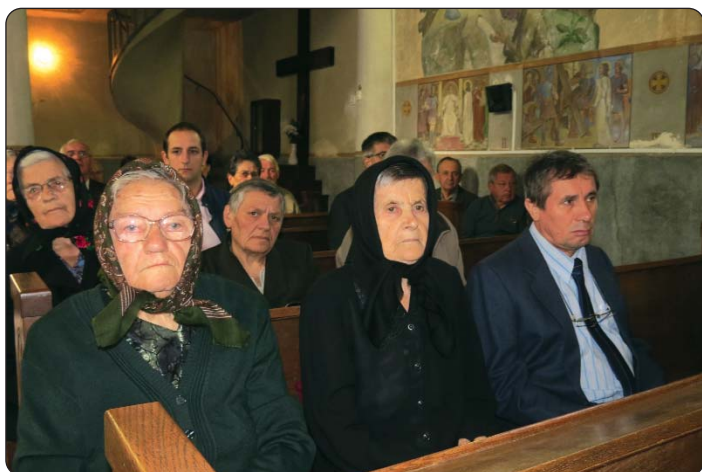
Misno slavlje na materinskom jeziku nasušna je potreba