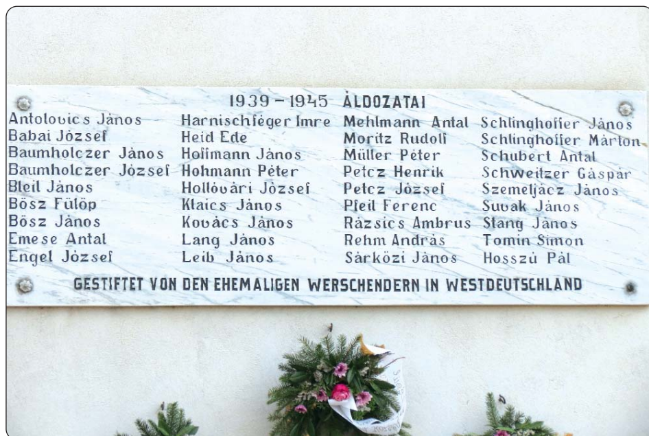
Spomen-ploča poginulima u svjetskim ratovima na zidu mjesne crkve

Kako reče Jakša Ferkov: Selo se prvi put spominje u 1015. godini po imenu Velente, u 1268. u obliku Wrsyndh , a 1289. Wersend .