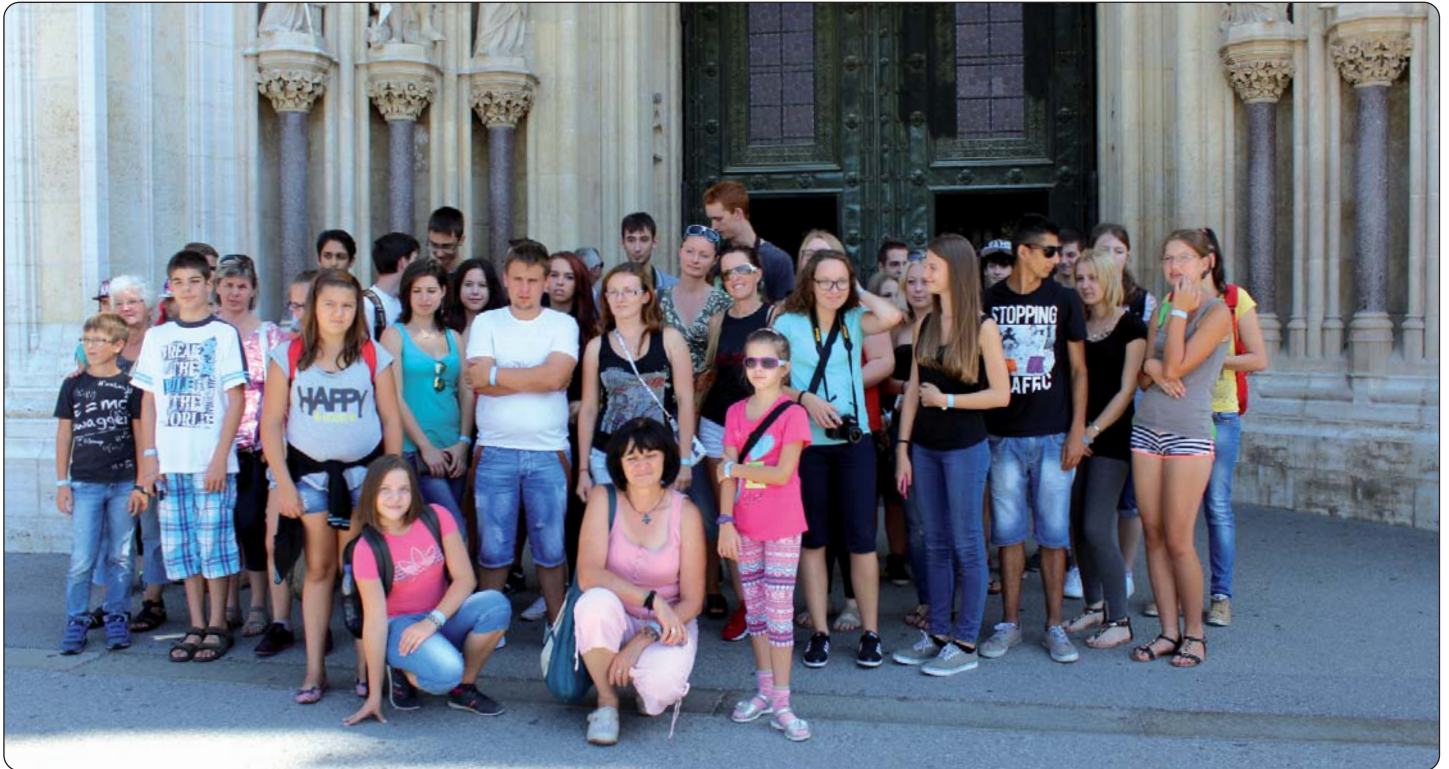
Pred zagrebačkom katedralom