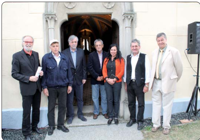
Organizatori i pozvani gosti