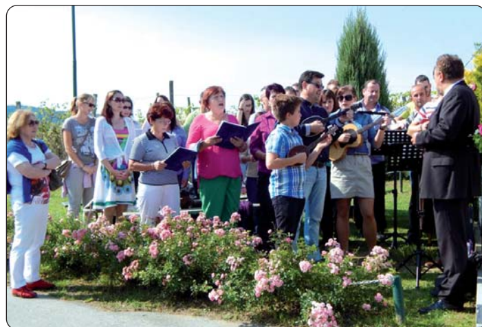
Jačkarice zbora „Peruška Marija“ i židanski tamburaši