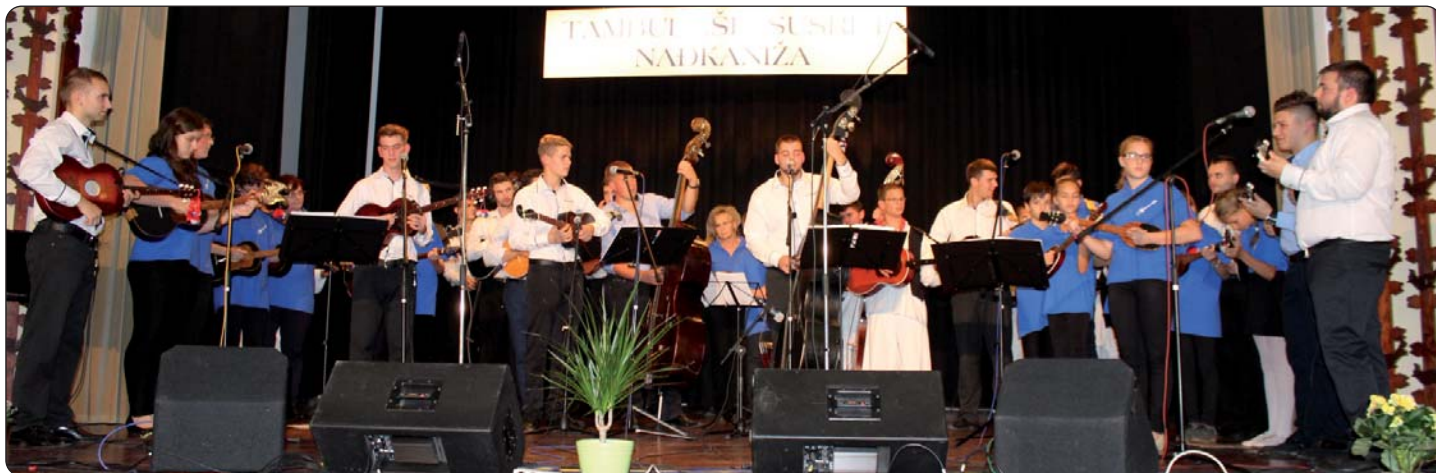
Svi sudionici na pozornici

Tamburaši kaniške hrvatske zajednice prije osam godina počeli su učenje tamburice, a danas već sami organiziraju Susret tamburaških sastava. Kaniške tamburaše okuplja Hrvatsko društvo tamošnje mladeži u čijoj je organizaciji održan i Susret tamburaških sastava, 19. rujna u Dvorani Medgyasszay (Kaniža), s pomoću kaniške Hrvatske samouprave. Na Susretu su se tamburice oglasile u rukama pedesetak tamburaša iz Kerestura, Koljnofa, Starina, Male Subotice (Hrvatska) i Kaniže.