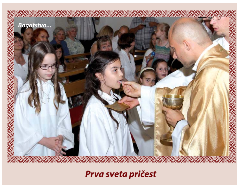
Prva sveta pričest