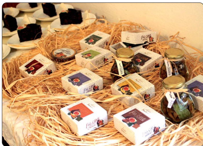
Samo nekoliko od smokvinih proizvoda