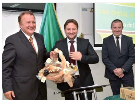
„Europa za građane“