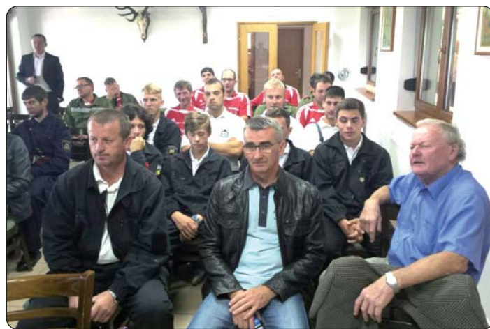
Židanski ognjobranci na skupu

nje hrvatskoga jezika, kulture i tradicije i med nami, Gradišćanskimi Hrvatima. Uz domaće Kulturno-umjetničko društvo „Ježek“, i Borištofci su u pjesmi i glazbom dali svoj doprinos programu, a Židanci su predstavili kusić bogate kulturne svakidašnjice. Nastup jačkaric zbora „Peruška Marija“, tamburašev iz sastavov