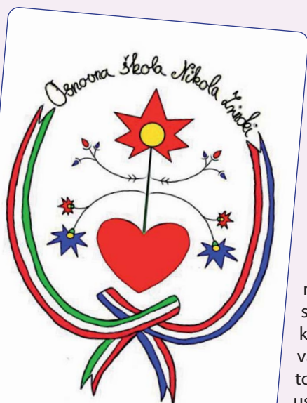
Logotip u izradbi Veronike Mező

Veronika Mező učenica je 8. razreda keresturske osnovne škole i vrlo voli crtati, tako se latila i crtanja logotipa škole. Prilikom izradbe logotipa ponajprije joj je bilo važno da ukaže na tip ustanove, tj. da se radi o narodnosnoj hrvatskoj ustanovi koja djeluje blizu hrvatsko-mađarske granice i