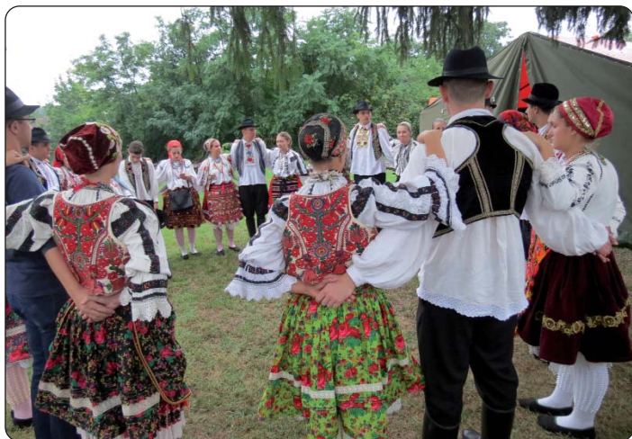
KUD Tanac pred nastup