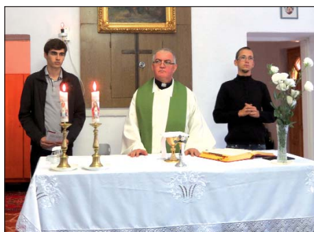
Dan sela u Semelju