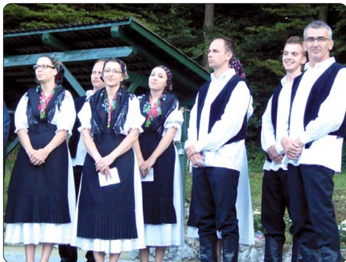
Člani HKD-a „Čakavci“ pred nastupom

U europskom projektu „Od ruralne tradicije prema budućnosti ruralnih područja u Europi sutrašnjice“ program je započet s djelačionicom za mlade pod naslovom „Kako poboljšati zapošljivost i mobilnost mladih ljudi u ruralnim sredinama“, a razgovaralo se