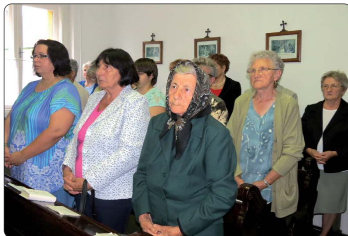
Na svetoj misi