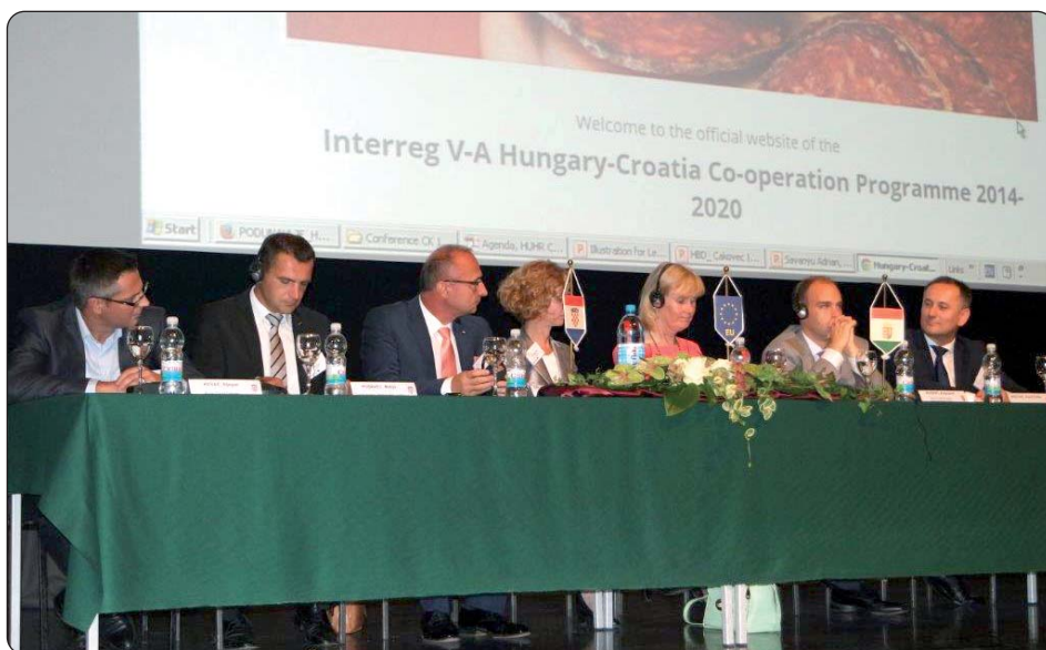
Program prekogranične suradnje Mađarska – Hrvatska 2014. – 2020.

U prekograničnoj suradnji Hrvatske i Mađarske završeno je jedno financijsko sedmogodišnje razdoblje, a nakon ostvarenih 169 projekata, ravnopravno s obje strane granice, vrijednih pedesetak milijuna eura, sada kreće novo razdoblje koje nudi 63 milijuna eura. Kako se upravo Međimurje pokazalo kao predvodnik u privlačenju sredstava te ostvarenju projekata, u čakovečkom Centru za kulturu održana je velika konferencija Programa prekogranične suradnje Mađarska – Hrvatska 2014. – 2020., čime je predstavljena ova EU financijska perspektiva. Konferencijom u Međimurju ujedno je proslavljen četvrti Dan europske suradnje, a naglašeno je kako je novi Interreg V-A Program suradnje Mađarska – Hrvatska u tijeku odobrenja kod Europske komisije.