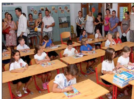
U školskom centru Miroslava Krleže 6. stranica