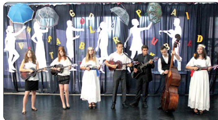
Školski tamburaški sastav