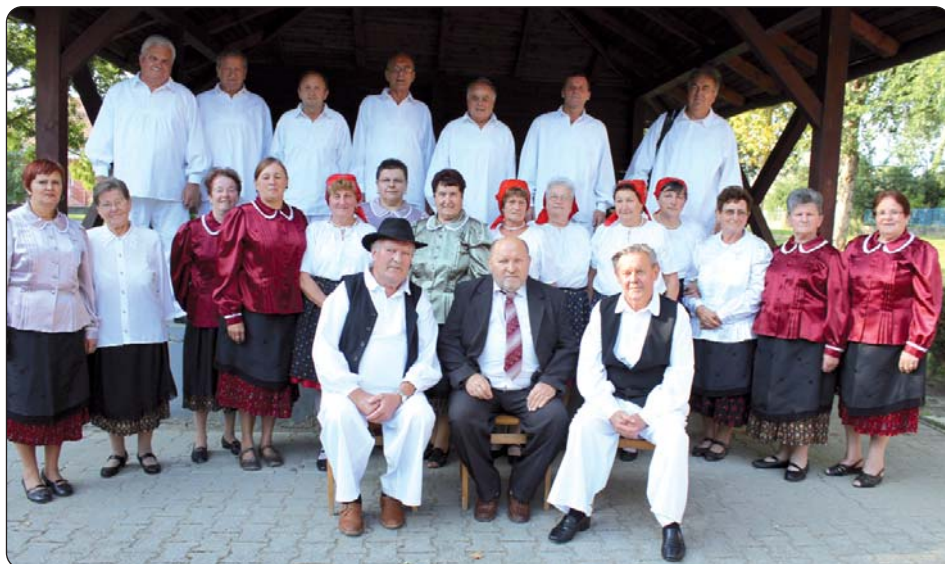
Družina koja surađuje već dvadeset godina