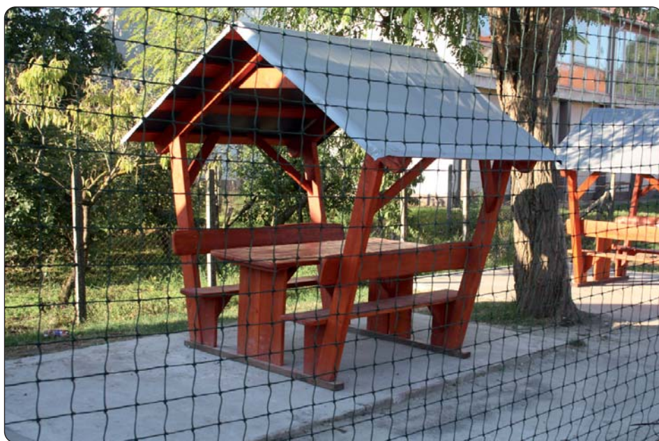
Obnovljeno dvorište, kutak za najmlađe