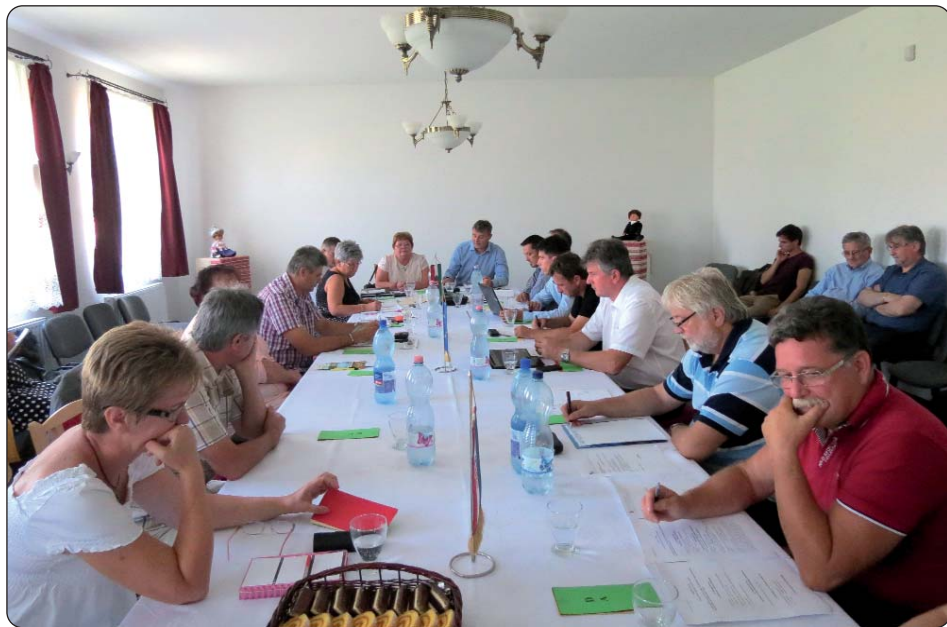
Skupštini je nazočilo 17 od ukupno 23 zastupnika Skupštine HDS-a

Sukladno Pravilniku o organizaciji i djelovanju, 29. kolovoza 2015. godine u Serdahelu je održana redovita sjednica Skupštine Hrvatske državne samouprave. Između ostaloga prihvaćeni su: Nacrt strateškoga (radnoga) plana za razdoblje od 2015. do 2019. godine, osnivački dokumenti dviju novih ustanova, u Pomurju i Podravini, te odluka o prodaji budimpeštanske nekretnine u Nagymező ulici 68.