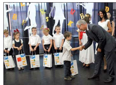
Otvorena školska godina u HOŠIG-u 10. stranica