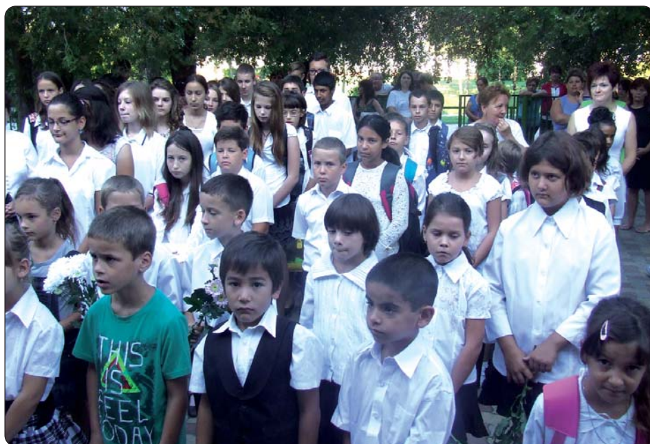
Učenci martinačke osnovne škole