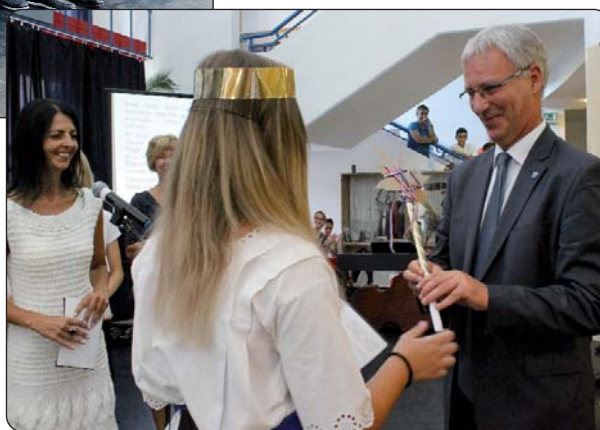
Svima sretan početak nove školske godine