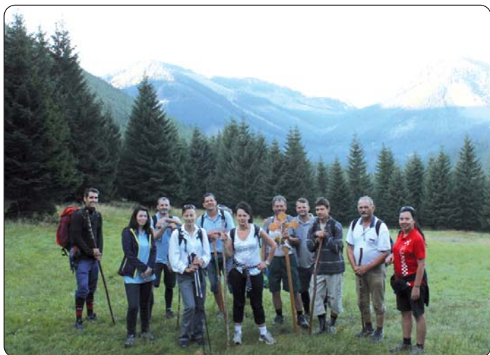
Stanka za Brigom plača

Mogyorósi, farnik Kemlje. U svetoj prodiki naglasak dobiju riči pravičnost, milosrdnost, vjernost i kako je svaki hodočasni put borba človiaka sa samim sobom, a tako i s Bogom. Pobijediti samoga sebe u dvojbi, preskočiti prepreke, iščistiti se u duši prik boli i mentalno se isključiti iz svakidašnjice, i to je cilj. Ove dane vik se mora iskristalizirati misao, kako je naš tarhet vjera u boljem, molitva za naše namjere i prošnje ter velika tuga i batrenje u našem putovanju, koji „križ“ človiak dobrovoljno zame na se. Prvi večer drži za nas još par presenečenj od vičere i posjetom iz Bizonje, sve do mobilnoga tuširanja jer karkako se čudimo, u Austriji, u novi, moderni objekti društav u susjedstvu far, ne najde se