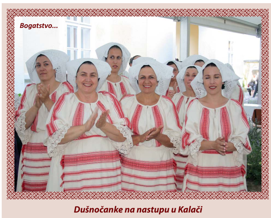
Dušnoćanke na nastupu u Kalači