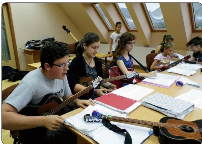
Učenje novih pjesama

Hrvatska samouprava Zalske županije među svoje ciljeve uvrstila je odgoj mladih na hrvatski vjerski život. U suradnji s mjesnim hrvatskim samoupravama i školama, u zadnje vrijeme sve više mladih nazočilo je na hrvatskim vjerskim programima, a s istom namjerom organiziran je i tamburaški i vjerski Hrvatski kamp.