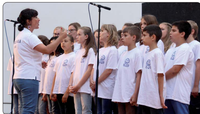
Domaćini, Dječji pjevački zbor Osnovne škole «Dorottya Kanizsai»