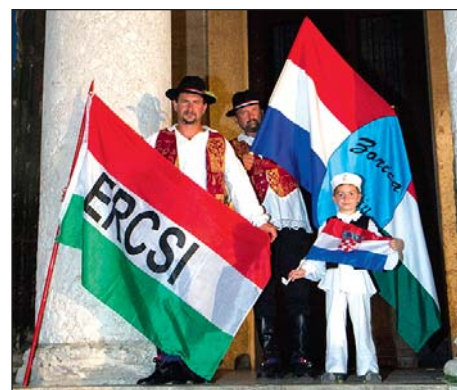
Erčinci u Puli i Poreču