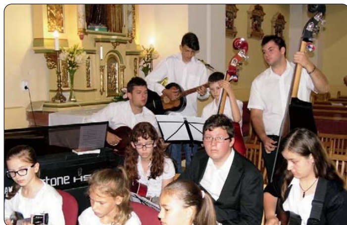
Sviranje na misnome slavlju

Kamp je okupljao 25 sudionika, međutim u pojedine programe uključili su se i drugi, npr. članice pjevačkoga zbora, Zrinski kadeti. Prema programu Kampa svaki dan su bila održana zanimanja u sviranju tamburice, vodili su ih kaniški tamburaši, odnosno sat vjeronauka s predsjednicom i nastavnicima. Organizirana je radionica izradbe cimera, učenje narodnoga plesa, izlet u kerestursku Zavičajnu kuću, kviz o Hrvatskoj, natjecanje u stolnom tenisu, nogometne utakmice i drugo.