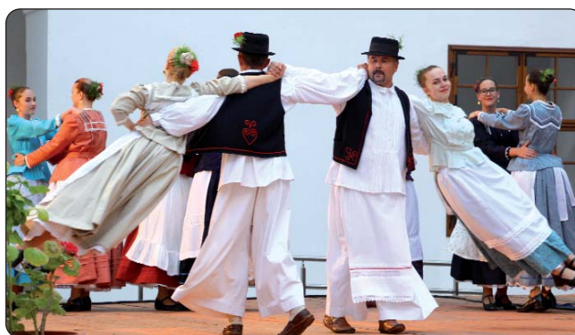
KUD Napredak iz Podravske Podgajaca

U drugom dijelu programa kada je na pozornici završavalo tridesetero mladih glazbenika, sudionika IV. tamburaškog tabora iz Orfúa, i tamni su se oblaci razvedrili nad tvrđavom. U njihovu repertoaru smo prepoznali napjeve Hrvata u Mađarskoj, jednako kao i pjesme iz Hrvatske, a dočarali su nam i skladbe klasične glazbe.