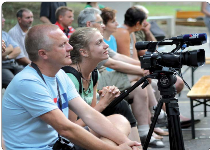
Suradnici HRT-a snimili su i dokumentarni film