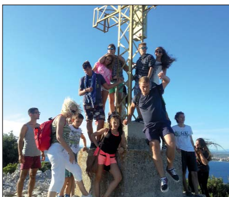
Na Faustovu otoku