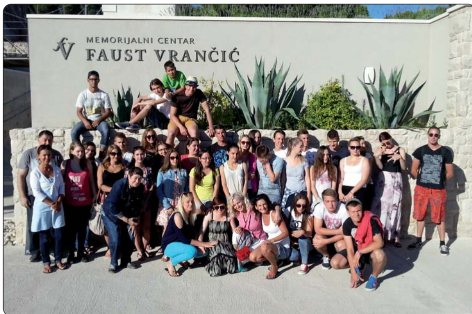
Pečuški su učenici sudjelovali zahvaljujući Matici hrvatskoj Ogranak Pečuh.

Otok Prvić, prozvan je Faustovim otokom, jer je na njemu svoje mladenačke dane i trajno prebivalište u crkvi Svete Marije od Milosti našao Faust Vrančić, znameniti hrvatski polihistor, znanstvenik, filozof, teolog, leksikograf, izumitelj, biskup i diplomat, a ova je godina bila u znaku velikih obljetnica njegovih životnih djela: 400 godina Novih strojeva („Machinae novae“) i 420 godina njegova Rječnika pet najuglednijih europskih jezika: latinskoga, talijanskoga, njemačkoga, mađarskoga i hrvatskoga („dalmatinskoga“). Akademsko predavanje s cjelovitim osvrtom na Faustov život i djelo i s posebnim naglaskom na djela čiju obljetnicu obilježavano održala je u Memorijalnom centru „Faust Vrančić“ posebna gošća škole, ugledna znanstvenica dr. sc. Marijana Borić, znanstvena suradnica na Odsjeku za povijest prirodnih i matematičkih znanosti HAZU. S bogatom kulturnom poviješću i baštinom otoka polaznici su se upoznali na terenskom predavanju koje je održao domaći uglednik Neven Skroza, posebno zaslužan za očuvanje starih otočkih pučkih napjeva, a redovita nastava održavala se u pet radionica tijekom pet dana i ukupno 50 nastavnih sati. Obvezna je bila Jezična radionica koju je vodila profesorica hrvatskoga jezika na osječkoj Graditeljsko-geodetskoj školi Đurđa Varžić Pavković i Radionica kre-