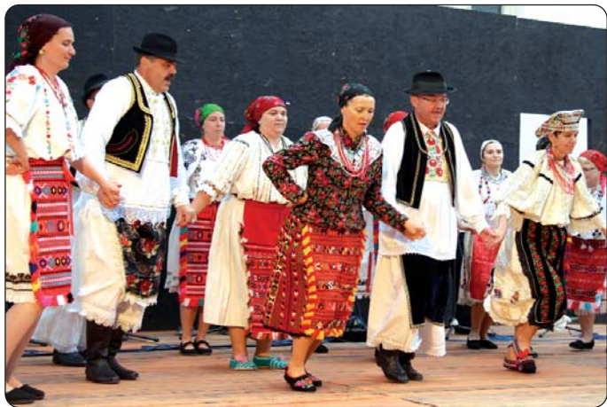
KUD Marica, skupina veterana

Dana 28. lipnja, u organizaciji Hrvatske samouprave grada Šikloša, a uz potporu Ministarstva ljudskih resursa održana je Hrvatska večer u velebnom prostoru šikloške tvrđave.