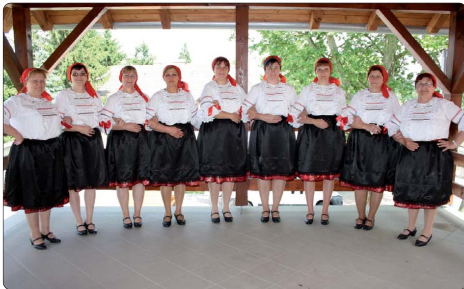
Pjevački zbor „Biseri Pustare“

Selo Pustara u zadnjim godinama mnogo se razvijalo, stara je škola obnovljena za integrirano središte za usluge zajednice u kojem djeluje knjižnica, teledom i ima raznih prostorija za civilne udruge, a sada se odvijaju radovi za gradnju potkrovlja za hostel, obnovljen je i načelnikov ured, dom kulture, a u tijeku je uređenje središta. Načelnik naselja Ladislav Prekšen želi da Pustara postane mjestom koje rado posjećuju ljubitelji aktivnog turizma. Nedavno je u selu izgrađeno malo nogometno igralište s umjetnom travom, igralište za odbojku na pijesku, među planovima je postavljanje stolova za stolni tenis, za šah, izgradnja igrališta za djecu i sadnja ukrasnog bilja. Samouprava je kupila 30 bicikla, a ubuduće planiraju organizirati njihovo iznajmljivanje. Pred domom zdravlja uredit će se trg. Poznato je da i sami mještani obožavaju šport, njihov je nogometni klub već godinama u prvoj županijskoj ligi, a često se organiziraju i seoski športski programi, kao što je to upriličeno i na Danu naselja (biciklistička dionica, kviz, igre spretnosti). U tijeku je i obnavljanje crkvenoga dvorišta, blizu crkve su izgrađene postaje (štacije) za križni put, a uz njega će biti postavljen kip svete Ane, odnosno uredit će se park. Prema očekivanjima, radovi će se završiti do seoskoga prošćenja, na Svetu Anu. Sve se ulaganja ostvaruju pomoću raznih natječaja za uljepšavanje naselja. Program Dana naselja odvijao se prema uobičajenom scenariju, prijepodne nakon svete mise