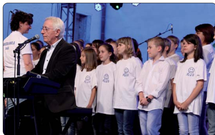
Oliver i Dječji pjevački zbor šikloške Osnovne škole „Dorottya Kanizsai”