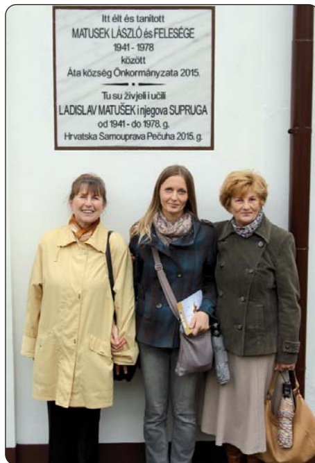
Kćeri i unuka bračnog para Matušek pred spomen-pločom u Ati

U Ati je 25. svibnja na zgradi nekadašnje škole, danas Zavičajne kuće, otkrivena spomen-ploča u čast 100. obljetnice rođenja Ladislava Matuška i njegove supruge, koji je učiteljvao u Ati od 1941. do 1978. godine. Spomen-ploča postavljena je s potporom atske Seoske samouprave i pečuške Hrvatske samouprave, a otkrili su je atski načelnik Károly Jung i dopredsjednik pečuške Hrvatske samouprave Stjepan Blažetin. Slijedila je povorka sudionika svečanosti kroza selo do mjesnog doma kulture, u kojem je priređen svečani program kojem su sudjelovali pečuški Ženski pjevački zbor Augusta Šenoe, kukinjski KUD Ladislava Matuška i pečuški KUD Tanac. Na dvojezičnoj spomen-ploči, koju su zajedno postavile atska Seoska i pečuška Hrvatska samouprava, piše: Itt élt és tanított MATUSEK LÁSZLÓ és FELESÉGE 1941-1978 között Áta község Önkormányzata 2015. / Tu su živjeli i učili LADISLAV MATUŠEK i njegova SUPRUGA od 1941. do 1978. g. Hrvatska samouprava Pečuha 2015. g. Otkrivanju spomen-ploče prethodila je sveta misa na mađarskom jeziku u kapelici smještenoj u nekadašnjoj zgradi škole, u čijoj je učionici danas zavičajna spomen-soba. Misu je prevodio Károly Gál, mišljenski župnik, a pjevao pečuški Ženski pjevački zbor Augusta Šenoe. Ovom je priredbom završen niz programa kojima se obilježila 100. obljetnica rođenja učitelja, kantora, zborovođe i sakupljača