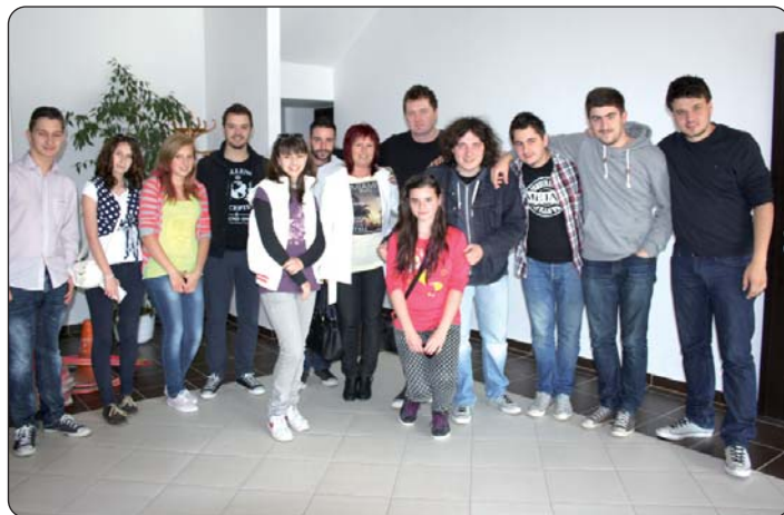
Svi bi se slikali s Mejašima.

položeni su vijenci kod spomenika palih boraca u svjetskim ratovima, a poslijepodne namijenjeno je za zabavu. U kulturnom