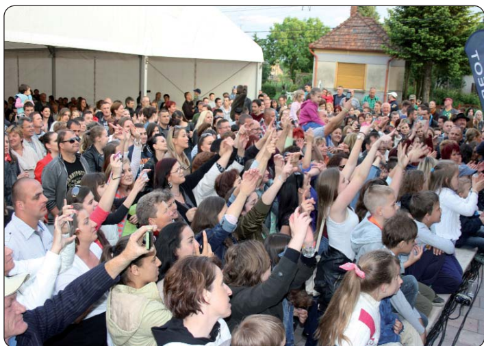
Gledatelji na koncertu Mejaša

programu nastupili su zborovi, skupine iz okolnih naselja, petripiska su djeca pripremila šaljivi igrokaz, mlinački pjevački zbor nastupio je s narodnim pjesmama i veselim plesom, nisu izostali ni Biseri Pustare s popijevkama, a ni serdahelske učenice koje su izvele moderni ples. Vrhunac je dana bio koncert Mejaša, na koji