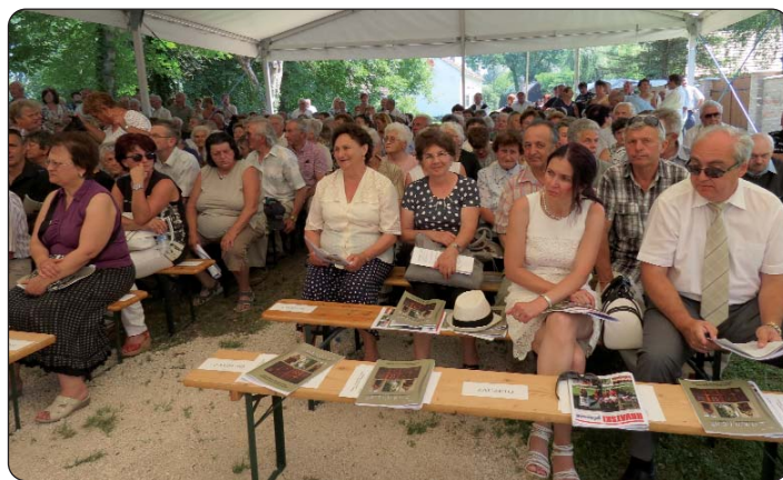
Svi su hodočasnici dobili Hrvatski glasnik, Zornicu novu i dvojezičnu knjigu autora Đure Frankovića.

Misa je bila na hrvatskom jeziku, ali je propovijed, nažalost, i na hrvatskom i na mađarskom jeziku. Ta činjenica nije zasme-