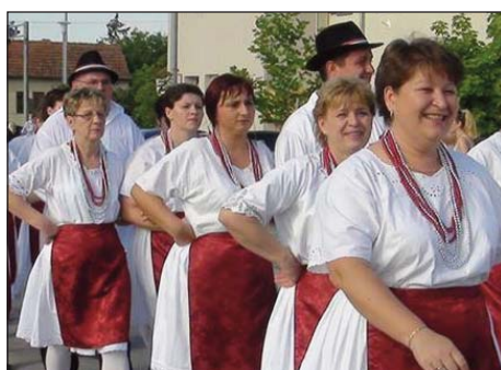
Čavoljci u Čačincima