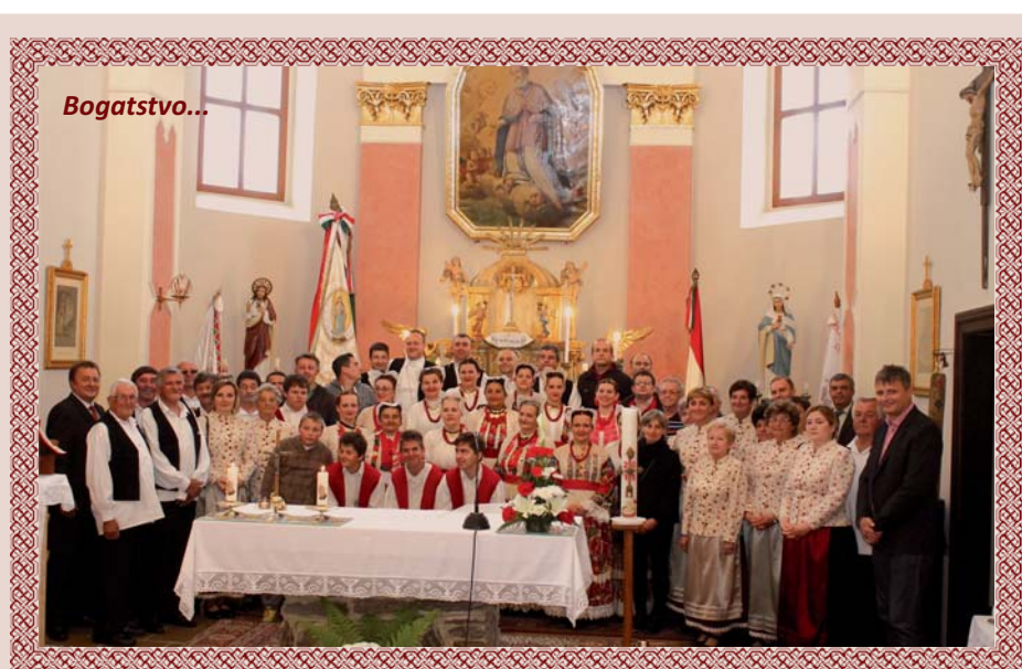
KUD „Posavina“ iz Budaševa s novimi prijatelji