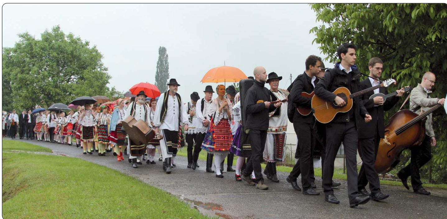
Duga atska povorka