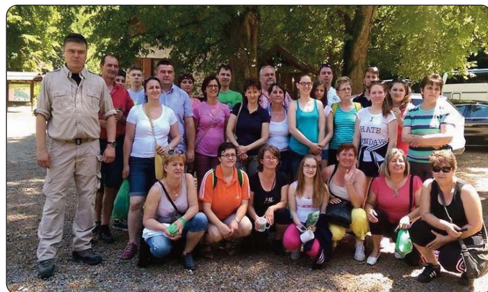
Članovi Bunjevačkoga kulturnog kruga na Jankovcu

Stana Gašparović László