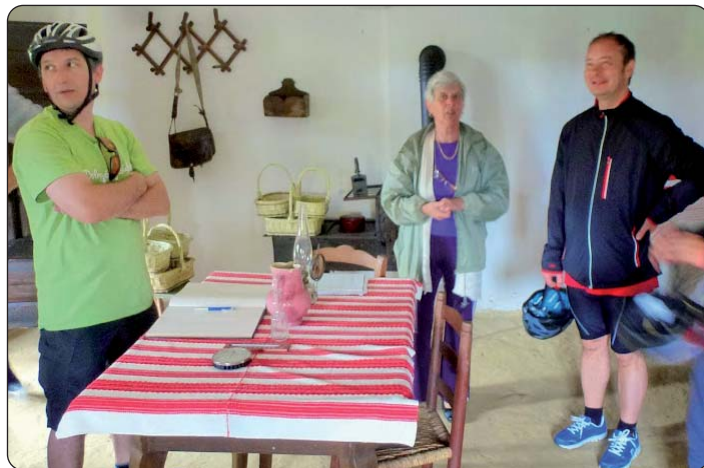
U lukoviškoj Zavičajnoj kući

Šeljinska Gradska samouprava već nekoliko godina zaredom organizira biciklistički put u Podravini, pod nazivom „Okruženi smo blagom“, kojim programom želi promicati prirodne ljepote tog područja, odnosno tamošnje vrijednosti, a ujedno i zdrav način života. Ove je godine biciklistički put ustrojen 16. svibnja, na njemu je sudjelovalo gotovo osamsto biciklista iz raznih krajeva Mađarske.