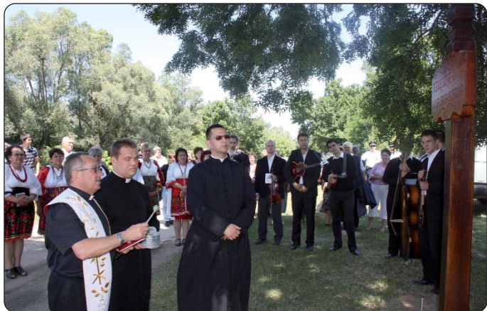
U Drvljancima 2011. godine, 1. srpnja

Hrvati iz naše domovine u Drvljancima su se našli i 2011. godine, 1. srpnja, kada je ustrojeno V. državno hodočašće Hrvata u Mađarskoj. Nakon Komara (Homokkomárom), prvoga državnog hodočašća u HDS-ovoj organizaciji 2006. godine (Zala), Kačmara (Bačka), Koljnofa (Jursko-mošonsko-šopronska županija) i Juda (Baranja), tada se, 2011. godine, HDS priključio tradicionalnom hodočašću podravske Hrvata, povodom blagdana Presvetoga Srca Isusova u Drvljancima, mjestu bez stalnih žitelja, hodočasti-lištem podravske Hrvata.