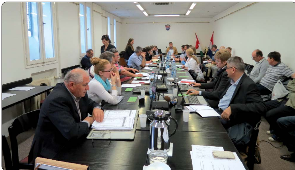
Skupštini je od 23 nazočilo 18 zastupnika.