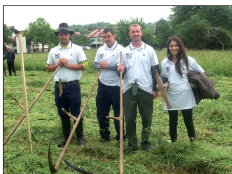
Deset godina prijateljstva 11. stranica