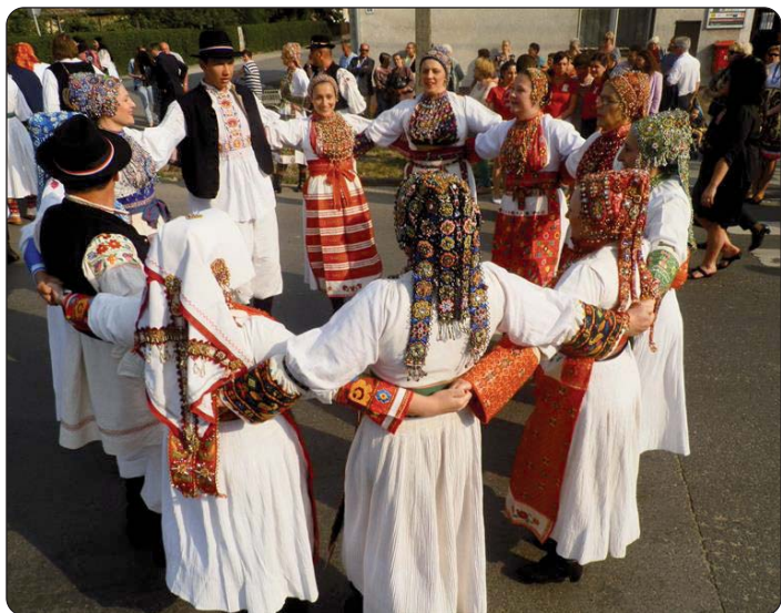
Folkloraši iz Grubišnog Polja

čjem i narodnosnom festivalu „Tko što zna“, odsvirao je splet napjeva. Šeljinska Hrvatska samouprava već godinama njeguje prijateljsku vezu s hrvatskom Općinom Suhopolje, tako je njihov nastup bio očekivan, pa su i pobrali buran pljesak nakon koreografije. Program je završio nastupom lukoviškog KUD-a Drava. Oni su otplesali koreografiju iz Podravine, kojom je ozračje do kraja programa ostalo odlično. Kao „nagrada“ dana svi sudionici bili su počašćeni. Šeljinci su pripremili bogat švedski stol, a zahvaljujući Martinčankama, svatko je mogao kušati ukusne domaće kolače. Završna je scena dana bilo druženje uz ples sa svirkom nazočnih orkestara.