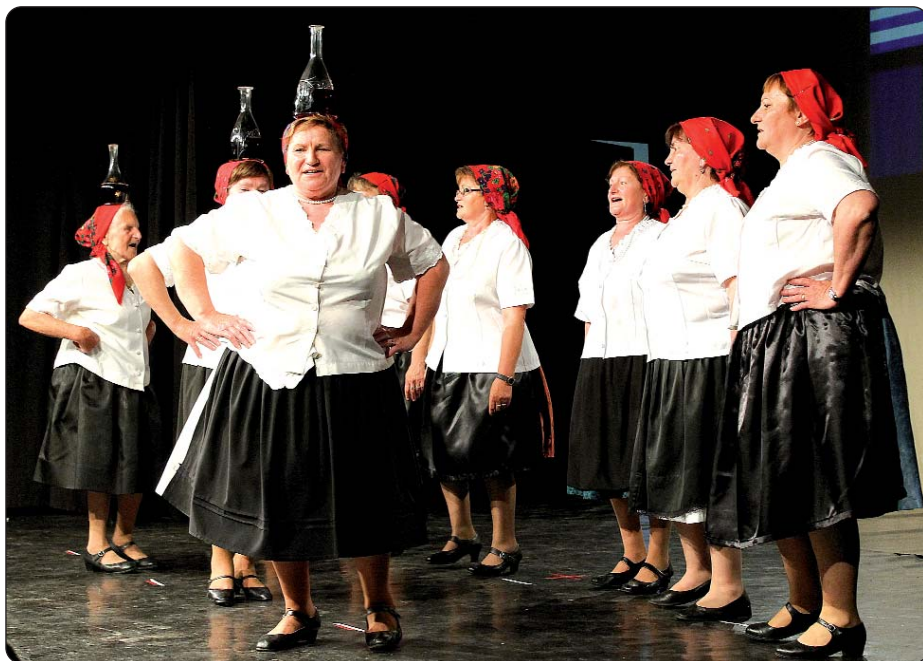
Djelić iz nastupa fićehaskoga ženskog pjevačkog zbora

U ferencvaroškome Prosvjetnom domu 23. svibnja sedmi put je priređen Narodnosni dan, na kojem tradicionalno nastupaju one narodnosne zajednice koje imaju svoju samoupravu. U sklopu priredbe s kulturnim su se programom predstavili Grci, Slovaci, Srbi, Rumunji, Hrvati i Romi. Na početku nazočne je pozdravio predsjednik Odbora za kulturu, vjerska i narodnosna pitanja László Mészáros koji je naglasio da su razne nacionalnosti tijekom povijesnih vihora u Mađarskoj pronalazili svoju domovinu. Ta duga i zajednička prošlost daje Ferencvarošu izričito šaroliki kulturni život. „Prisjetite se riječi Zoltána Kodálya: Kultura znači naobrazbu, usvojiti i održavati je na razini teško je, ali ju je izgubiti lako. Svi trebamo nastojati na tomu da ona kultura koja je u običajima, u jeziku i pismu, glazbi i plesu bude sastavnica našega života “ – istaknuo je g Mészáros. Posebno je pozdravio kotoripskog donaćelnika Roberta Ujlakija, koji je dopratio goste iz Hrvatske.