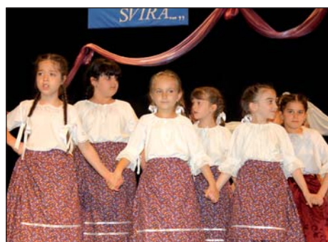
Županijska smotra folkloru 6. stranica