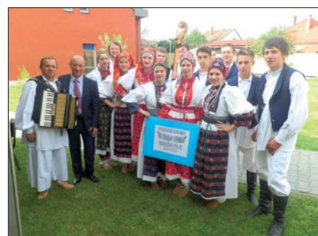
Proletni festival u Šeljinu 12. stranica