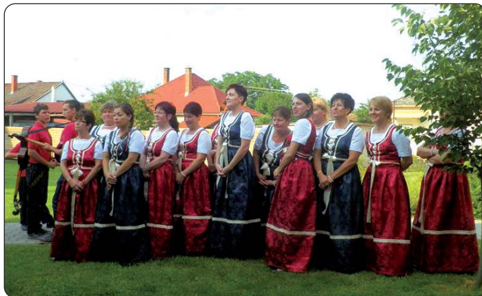
Šeljinska plesna skupina „Zlatne noge“

bunjevačkom koreografijom. Hrvatski gosti iz Kupinačkoga Kraljevca donijeli su koreografiju svoga kraja, a publika je imala priliku vidjeti nošnju koja je, kako reče njihova predsjednica, bila izabrana najljepšom hrvatskom nošnjom. Tamburaški sastav Biseri Drave, koji je osvojio zlatnu kvalifikaciju u Tatabányi na dje-