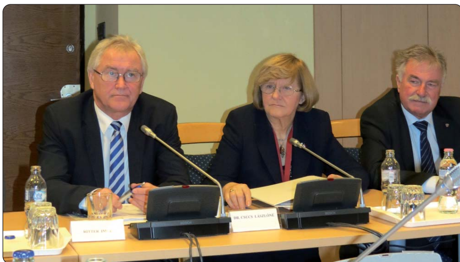
Na sjednici Narodnosnog odbora Mađarskog parlamenta

Novi fond za ulaganja i obnovu povećat će se s 440 milijuna forinti u odnosu na 2015. godinu, u kojoj on iznosi četiristotinjak milijuna forinti, u 2016. iznosit će 882,4 milijuna forinti. Povećat će se i fond za potporu narodnosnim kazalištima s dodatnih sto milijuna forinti, a utemeljit će se i fond za obrazovne ustanove s malim brojem djece s proračunom od 80 milijuna forinti. Fond za potporu programima civilne sfere, narodnosnih samouprava, kampova i usavršavanja narodnosnih pedagoga bit će 640 milijuna forinti. Ta povećanja, ističu narodnosni parlamentarni glasnogovornici, upravo su plod činjenice njihove nazočnosti u najvišem zakonodavnom tijelu Mađarske, gdje brzo i lako uspostavljaju dodire s predstavnicima političkih snaga, tako svi oni problemi koji su se do sada teško rješavali