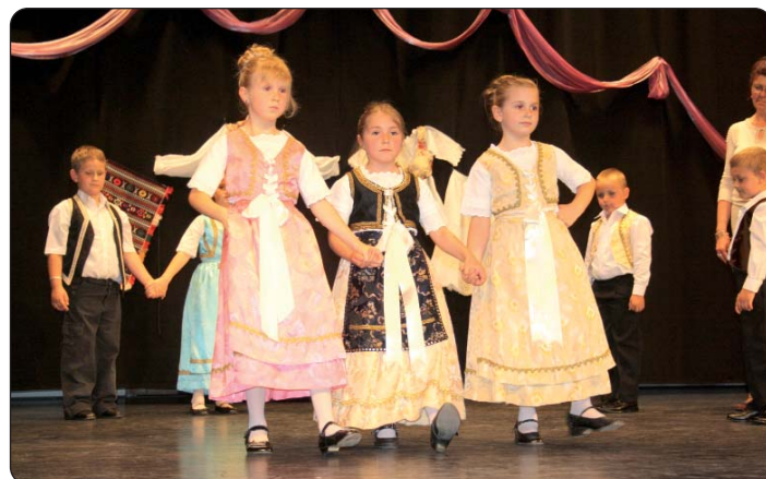
Mališani garskog vrtića