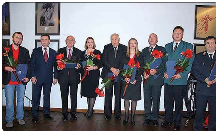
Generalnoj konzulici Vesni Haluga dodijeljeno je najviše općinsko priznanje – Plaketa Općine Lendava.

Generalnoj konzulici Republike Hrvatske Vesni Haluga 28. listopada 2014. povodom 18. godišnjice Općine Lendava (Slovenija) dodijeljeno je najviše općinsko priznanje – Plaketa Općine Lendava za uspješnu suradnju spomenute Općine i Međimurske županije na području kulture, gospodarstva i politike; nadalje za predlaganje i potpisivanje Sporazuma o suradnji između Općine Lendava i Međimurske županije, za promidžbu Općine Lendava izvan njezinih granica, prije svega preko Hrvatskoga kulturnog