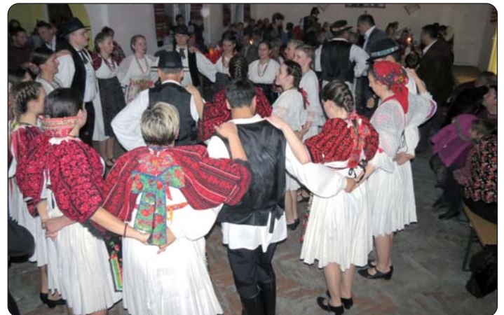
Folklorši su dočarali staru bučuru.

Dočekale su nas upaljene svijeće i zamračeni dom kulture, slike svetaca i tkanine na zidu i prozorima, pozornica s klupama, u kutu portreti martinačkoga pjesnika, nekoliko relikvija i predmeta iz prošlosti baka i djedova, onih koji već davno nisu među nama i onih koji još čuvaju njihove priče. Organizatori su željeli dočarati bal iliti Martinačko veselje „anno 1914“.