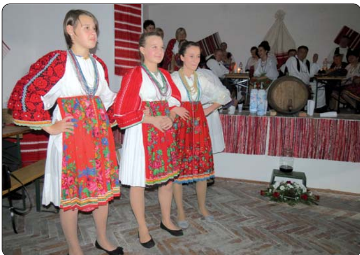
Nastupile su i učenice martinačke Dvojezične osnovne škole.