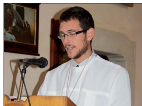
Dvojezična misa u Sumartonu