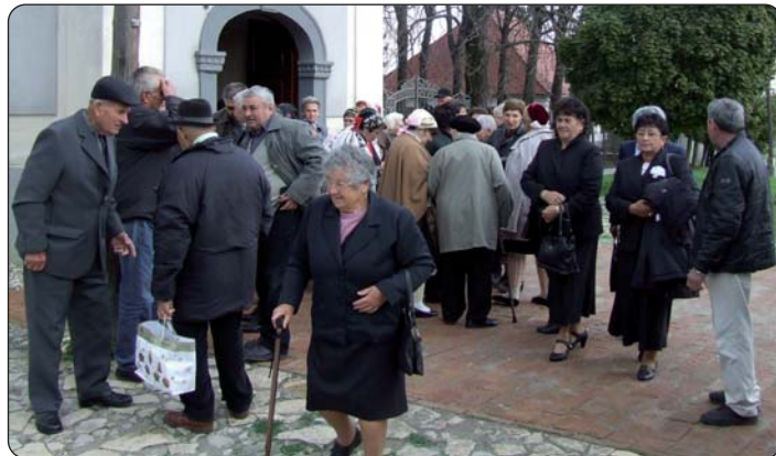
Ispred vršendske crkve

Vjerska i kulturna udruga šokačkih Hrvata u Vršendi i Hrvatska samouprava toga sela, 25. listopada uz VIII. Susret crkvenih pjevačkih zborova, u mjesnom domu kulture priredile su tradicionalno Šokačko sijelo.