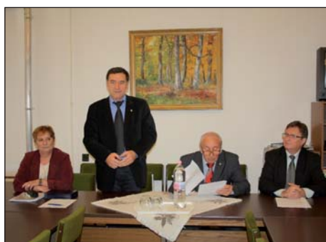
Osnivačka sjednica HSBKŽ