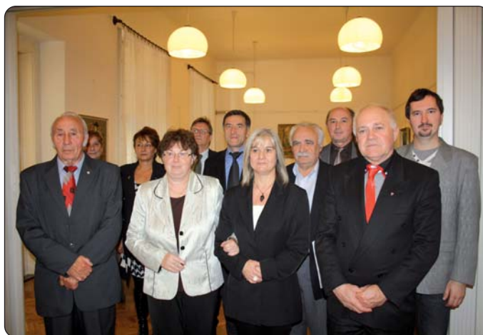
Dio nazočnih na osnivačkoj sjednici

ALJMAŠ – Hrvatska samouprava grada Aljmaša, Rimokatolička župa i Bunjevački «Divan klub» 29. studenoga suorganiziraju Spomendan naslovnog biskupa Ivana Antunovića i Dan bunjevačkohrvatske kulture. Program počinje u 14 sati misnim slavljem na hrvatskom jeziku i polaganjem vijenaca kod spomen-ploče na župnom uredu. Slijedi prigodni kulturni program koji će se održati u Prosvjetnome središtu, s početkom u 16 sati. Sudjeluju vrtićaši i učenici hrvatske skupine, Pjevački zbor «Őszikék», tompanski KUD „Kolo” i aljmaški KUD „Zora”. U 19 sati priređuje se Hrvatski bal, a za dobro raspoloženje pobrinut će se garski Orkestar „Bačka”. Ulaznica je za bal 500 Ft. Narudžba ulaznica na telefonu 06-70 388 71 98 ili 06-70 967 93 77, u pretprodaji 18. i 25. studenog u mjesnom domu kulture između 17 i 18 sati.