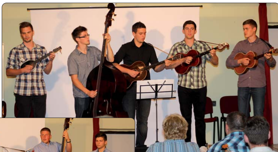
Dečki iz trih sel

vanju nacionalnoga identiteta širega područja Bosne i Hercegovine. Na kraju tamburaškoga festivala su zasvirali koljnofski Bondersölji, ki isto tako kot i prethodni Petrovišćani jur raspolažu s vlašćimi jačkami ke su pravoda zavridile burni aplauz. Potom su svi bili pozvani u krčmu Koli na zajedničko druženje. Poslidnji, šesti sastanak unutar „Prave kopče” je predvidjen ov tajejan, u četvrtak uvečer, s temami povijest jezika i sociologija. U Koljnofu 21. no-