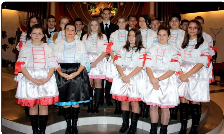
Krizmanici u serdahelskoj crkvi s vjeroučiteljicom