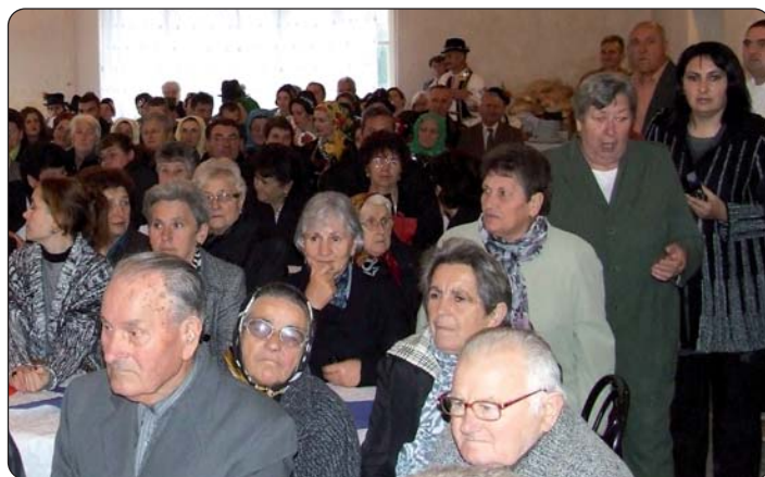
Prepun vršendski dom kulture