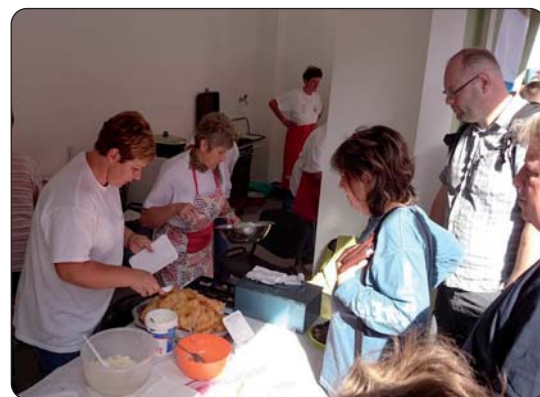
Rado se kušao pomurski specijalitet.