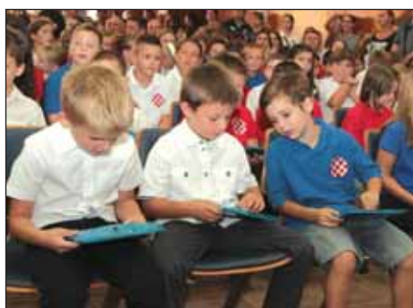
Početak školske godine