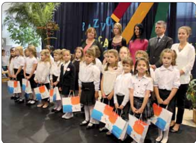
Prvaši postali članovi velike HOŠIG-ove obitelji.