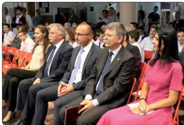
Visoki uzvanici znatizeljno prate događanja na sceni.

Prvi radni dan u HOŠIG-u ponovno nas je uvjerio kako je budimpeštanska škola odista mjesto čarolija.