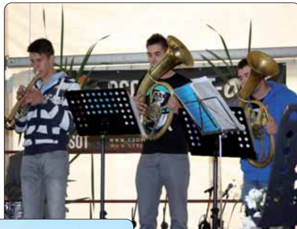
Puhački sastav KUD-a Sumarton na Danu naselja

Na Dan naselja u Sumarton je stiglo izaslanstvo prijateljske samouprave budimpeštanskoga XV. okruga. Osim uobičajenih sportskih i kulturnih programa na kojima su nastupali serdahelski i sumartonski učenici, te članovi KUD-a Sumarton predstavljena je knjiga nekadašnjega mještana Josipa Mihovića „Odalenn délen / Geni na more zovu”.