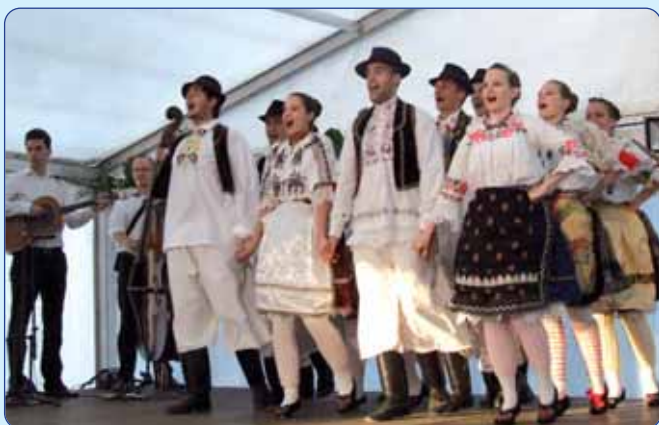
KUD Baranja iz Pečuha