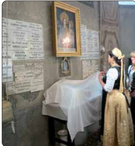
Pred slikom Racke Madone

U Erčinu je i ove godine, 15. kolovoza, bio velik blagdan, hrvatsko proštenje koje