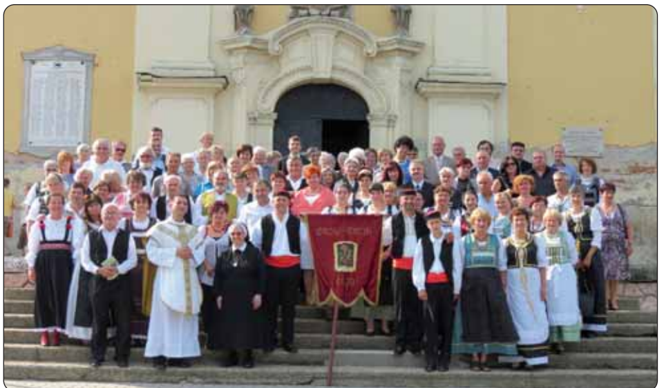
Fotografija za uspomenu ispred prekrasnog erčinskog crkvenog zdanja