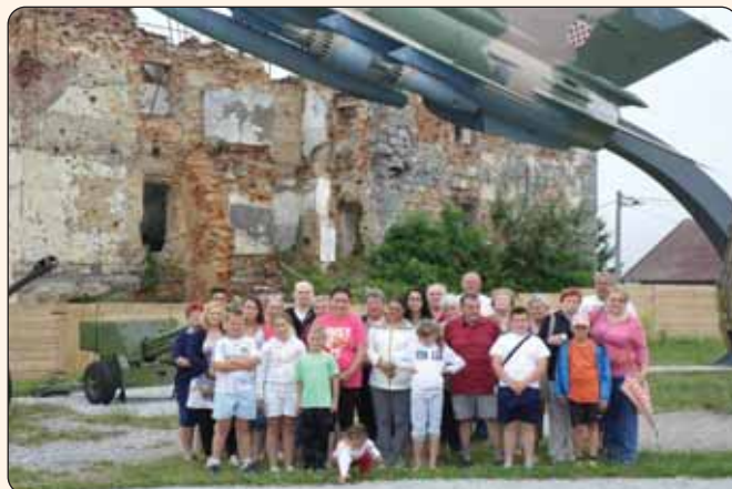
Na mjestu budućeg muzeja Domovinskog rata