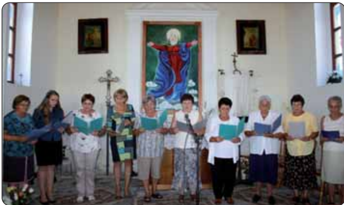
Kaćmarski ženski pjevački zbor