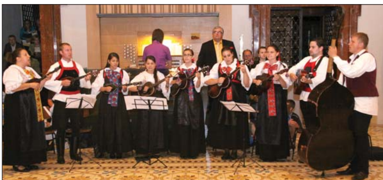
Bizonjski tamburaši su svirali i na jurskom shodišću Gradišćanskih Hrvatov

Veterani NK Sutle i petrovski seniorsi na nogometnoj utakmici