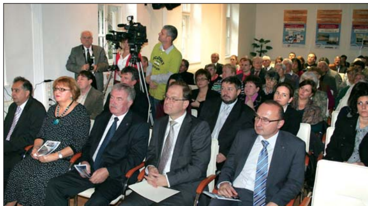
Uzvanici i znatiteljna publika