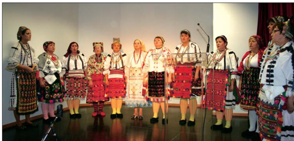
Ženski pjevački zbor Augusta Šenoa