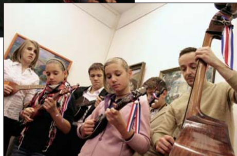
Tamburaški sastav budimpeštanske Hrvatske škole

„Ljeti, koliko god mu se pružala mogućnost, posjećivao je voljeni Jadran koji mu je, osim brežuljaka u okolici Mohača i u Baranji te mohačkih vinograda, bio glavna tema njegovih slika” – navodi se u popratnom katalogu, što su ga sastavila također njegova djeca. Ponovno je zasvirao školski sastav i uz pop-