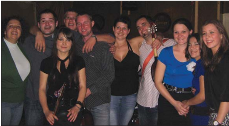
Slavljenici na rođendanskoj fešti

Prvoga oktobarskoga vikenda Bizonjski tamburaši su svečevali svoje prvo desetljeće postojanja. Bivši i sadašnji kotrigi sastava 6. oktobra, u subotu, otpodne su se najprlje medjusobno družili, a uvečer su se prikdali mulatovanju s prijatelji i poznanici ter obožavatelji u okviru seoske fešte. Iako su na balu svirali koljnofski Štrabanci, na zahtjev publike i sami slavljениci su si zgrabili instrumente i u pratnji velike ovacije su izveli mali koncert.