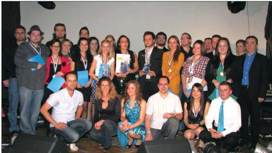
Svi diozimatelji i organizatori petoga jubilarnoga Glasa Gradišća

U prethodni ljeti se je jur dokazalo, kako je najuspješnija i dobro pohodjena priredba Društva gradišćanskohrvatske mladine u Ugarskoj, upravo ta glazbeno-naticateljski show pri kom cijelo Gradišće ima priliku viditi, čuti i aplaudirati šikanim glasom našega područja. Jačenje u solu polag žive glazbe, nije ni toliko lako kako to izgleda, posebno ne za amatere i hobi-jačkare, ki morebit prvi put se daju nagovoriti na sudjelovanje u zabavno-glazbenom gradišćanskom programu. Ovo ljeto svi smo mogli biti zadovoljni, u prvom redu pak publika, ka je dobila kvalitetno izdjelane kompozicije, dobro sastavljene bezbrižne ure uz dobro mužiku, atraktivne pjevačice, privlačne jačkare, i ne nazadnje i onu čut da vjerojatno smo opet dobili jednu generaciju, ka ne samo rado poslušša i pjeva nego i razumi, što jači.