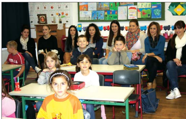
Studenti među prvašima

Učenici serdahelske škole svake godine s velikim uzbuđenjem čekaju studentice i studente na nastavu, neki od njih pripreme i spomenare da u njih gosti upišu dojmove boravka u Serdahelu. Raspored tjedna uglavnom je uhodan, upočetku koordinatorka rasporedi studente po razredima, a oni tijekom tjedna održe sate od 1. do 5. razreda. Svaki put pripremaju se s nastavnim pomagalicama, koriste se pametnim pločama i drugim zanimljivostima za motivaciju. Zajedno uče nove pjesmice, čitaju jednostavne priče o kojima poslije razgovaraju i crtaju. U prvom i drugom razredu bilo je veselo. Učenici su se kroz film upoznali sa šegrtom Hlapićem, likom poznatoga hrvatskog dječjeg romana Čudnovate zgrade šegrta Hlapića, a zatim razgovarali o njemu, oslikali likove romana. U višim razredima pomoću projektoru predstavljani su nacionalni parkovi Hrvatske, znamenitosti grada Zadra, koje će za nekoliko godina moći pogledati upravo zahvaljujući suradnji dviju ustanova. Ipak je najveselije u odmoru kada se može nevezano razgovarati, pitati nešto osobno od mladih učiteljica, malo se igrati. Studenti nikada ne