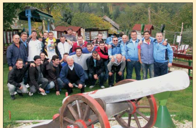
Pred utakmicom u Gornjem Četaru