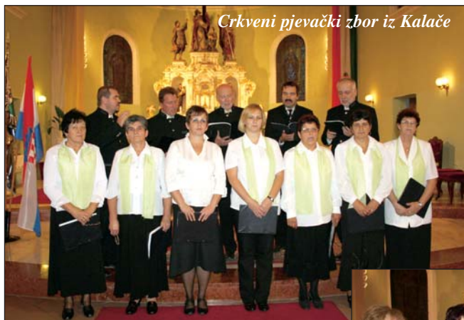
Crkveni pjevački zbor iz Kalače

nik organizacijskog odbora mr. Lazar Ivan Krmpotić, koji je nizom svojih predavanja u okviru Spomen-dana biskupa Ivana Antunovića u Aljmašu, pokrenutih 1990. godine u organizaciji Bunjevačkog „Divan kluba”, odnosno predsjednika Marka Markulina, tijekom 1990-ih godina umnogome pridonio istraživanju i populariziranju njegova života i djela tijekom. Ta su nastojanja 2001. odnosno 2002. godine okrunjena pretiskom knjige Život i rad biskupa Ivana Antunovića, narodnog preporoditelja , iz 1935. godine, autora dr. Matije Evetovića, te pretiskom najvrjednije knjige podunavskih Hrvata u 19. stoljeću, Antunovićevom Raspravom o podunavskim i potisanskim Bunjevcima i Šokcima u pogledu