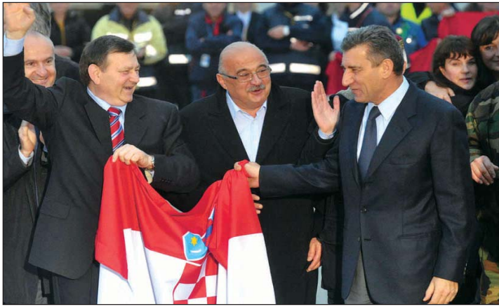
Mladen Markač, Ivan Čermak i Ante Gotovina

Dana 16. studenoga u 9 sati Žalbeno vijeće Haškoga suda počelo je s izricanjem presude generalima Antu Gotovinu i Mladenu Markaču. Žalbeno vijeće Haškoga suda oslobodilo je generale Antu Gotovinu i Mladena Markača svake odgovornosti za sudjelovanje u udruženome zločinačkom pothvatu i zločine počinjene tijekom i nakon operacije Oluje, tako što je prvo srušilo prvostupanjsku presudu kojom su bili osuđeni na 24, odnosno 18 godina zatvora, a potom proučilo ponovno dokaze i zaključilo da dvojica generala ne mogu biti ni alternativno odgovorna kao pomagači u udruženome zločinačkom pothvatu, a ni zbog propusta kao zapovjednici.