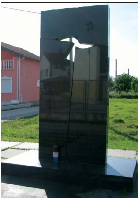
Mramor u Škabrnji, postavljen u spomen na 27 hrvatskih branitelja i civila pogubljenih 1991–1992. u velikosrpskoj agresiji na Republiku Hrvatsku

VUKOVAR/ŠKABRNJA – Prije 21 godinu, 18. studenoga, pao je Grad heroj Vukovar; Siniša Glavašević napisao je prekrasnu crticu Priča o gradu. „Jer, tko će ostati ako se svi odreknu sebe i pobjegnemo u svoj strah? Kome ostaviti grad? Tko će mi ga čuvati dok mene ne bude, dok se budem tražio po smetlištima ljudskih duša, dok budem onako sam bez sebe glavinjao, ranjiv i umoran, u vrućici, dok moje oči budu rasle pred osobnim porazom?“ Bitka za Vukovar počela je 25. kolovoza, a završila 18. studenoga 1991. godine. Do sloma obrane grada poginule su 1.624 osobe, a ranjeno ih je više od 2.500. U srpske koncentracijske logore odvedeno je oko pet tisuća zarobljenih branitelja i civila, a iz grada je prognano oko 22 tisuće Hrvata i ostalih nesrba. Na popisu zatočenih i nestalih osoba u Domovinskom ratu iz Vukovarsko-srijemske županije još je 436 hrvatskih branitelja i civila od kojih se većini svaki trag gubi upravo u Vukovaru 1991. godine. Prije 21 godinu, 18. studenoga srpske paravojne postrojbe, potpomognute tenkovima, topništvom i zrakoplovima, u rano jutro krenule su prema Škabrnji. Ondje je izvršen strašan pokolj. Nakon topničkog napada postrojbe JNA i srpske paravojne postrojbe ušle su u selo uništavajući kuće, gospodarske objekte, crkvu. Žene, djeca i starci ubijani su dok su izlazili iz skloništa. Prvi dan srpske okupacije ubijena su 43 škabrnjska civila i 15 branitelja.