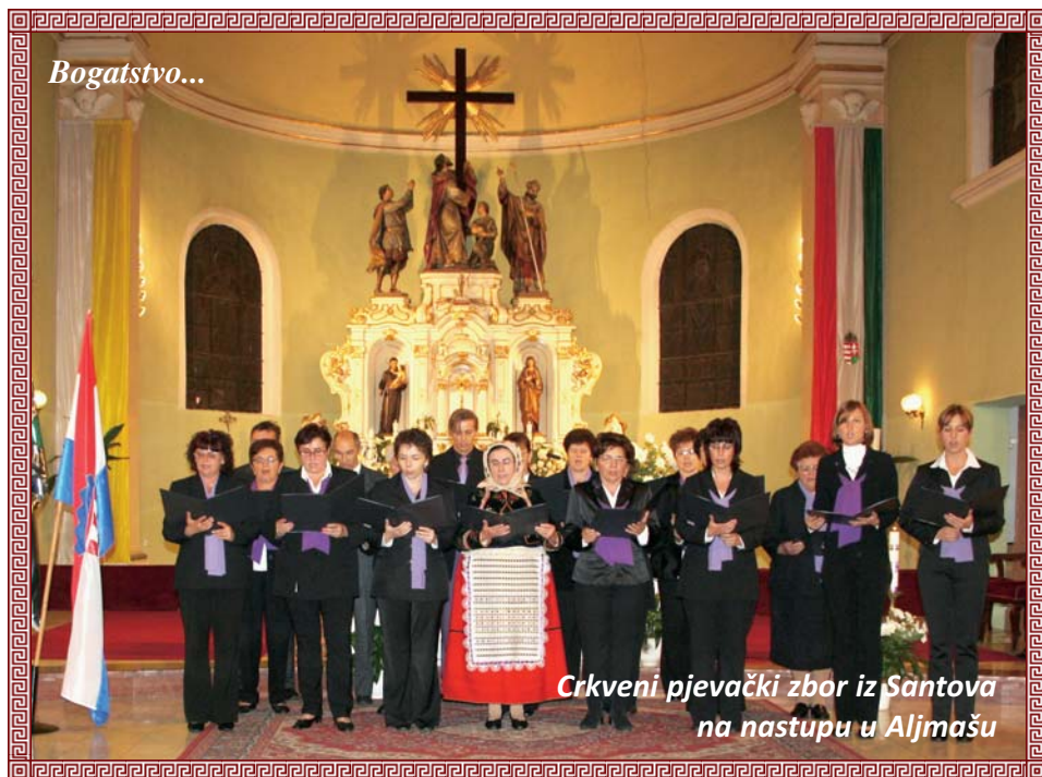
Crkveni pjevački zbor iz Santova na nastupu u Aljmašu