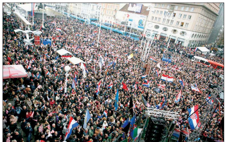
Trg bana Jelačića 16. listopada u poslijepodnevnom satima

Ovo je jedan od rijetkih dana u životima nacija i pojedinca kad su svi radosni, a praktično nitko žlurad. Ovo je bio jedan izljev radosti, one obične zdrave ljudske radosti, ne sreće zbog toga što je itko ikad patio ili mu je bilo loše, nego naprosto jedan ogroman kamen sa srca, koji nam je pao, ovime pokazujemo da imamo i srce. Sretan im put doma – rekao je hrvatski premijer Zoran Milanović.