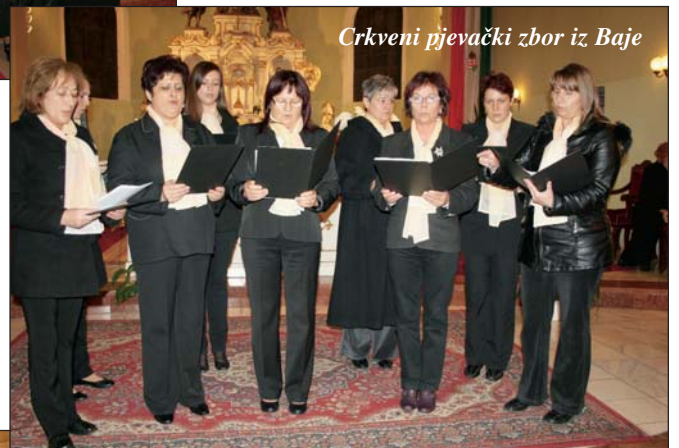
Crkveni pjevački zbor iz Baje

kraj 1980-ih, odnosno 1988. godine u Subotici povodom obilježavanja 100. obljetnice njegova rođenja, kada je u njegovu čast organiziran dvodnevni znanstveni skup i postavljen reljef u subotičkoj katedrali. Među najzaslužnijima za to bio je predsjed-