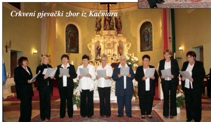
Crkveni pjevački zbor iz Kačmara

narodnom, vjerskom, umnom, građanskom i gospodarskom (Beč, 1882) , ali i postavljanjem reljefnih spomen-ploča u Kalači i Aljmašu. Međutim ostalo je neistraženo mjesto na kalačkome groblju gdje je pokopan. Od tada se u spomenutim naseljima redovito obilježavaju spomen-dani prigodnim svečanostima i misnim slavljinama na hrvatskome jeziku.