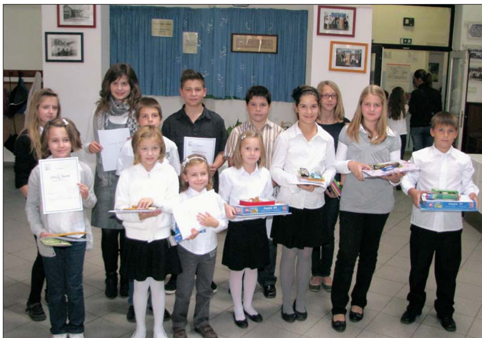
Dobitniki 17. Nakovićevoga naticanja