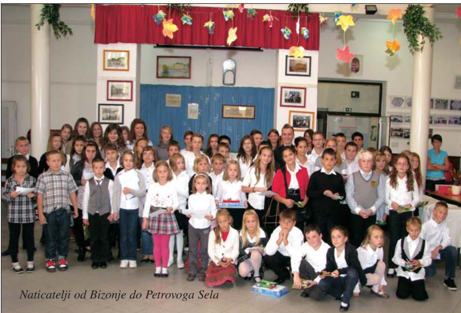
Naticatelji od Bizonje do Petrovoga Sela