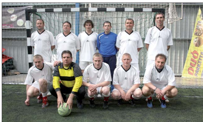
Zalska (fičehaska) momčad – osvajač 3. mjesta

U ravnopravnom nadmetanju za treće mjesto, pokazujući više snage i želje za pobjedom, momčad Zale – Fičehaz savladala je šomođsku momčad 3 : 2, te osvojila treće mjesto i brončanu medalju. Ponovno zanimljivo i neizvjesno bilo je u završnom susretu turnira, u kojem je opet igrala baranjska momčad i lani trećoplasirana momčad Jursko-mošonsko-šopronske županije – Koljnof. Pošto je jursko-mošonsko-šopronska momčad povelila s 1 : 0, činilo se da bi moglo doći do iznenađenja, ali je u ravnopravnoj i do kraja neizvjesnoj utakmici, nakon poravnjanja iz kaznenog udarca, pred sam kraj susreta baranjska momčad uspjela preokrenuti rezultat, i pobijedila s 2 : 1, i tako četvrti put zaredom osvojila Hrvatski državni malonogometni kup.