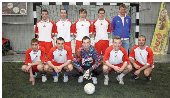
Baranjska momčad – osvajač 1. mjesta