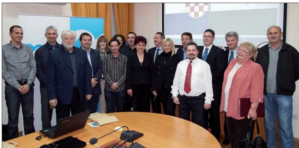
Izaslanstvo grada Baje s domaćinima u Biogradu na Moru

Izaslanstvo grada Baje, u kojem su bili bajske gospodarstvenici, ali i predstavnici bajskih Hrvata, od 21. do 24. ožujka boravilo je u posjetu prijateljskim naseljima Labinu i Biogradu na Moru. Tako je nakon suradnje na polju kulture, obrazovanja i športa, predstavljanjem gospodarskih mogućnosti grada Baje i suradnje s prijateljskim gradovima u Hrvatskoj pokrenuta i gospodarska suradnja.