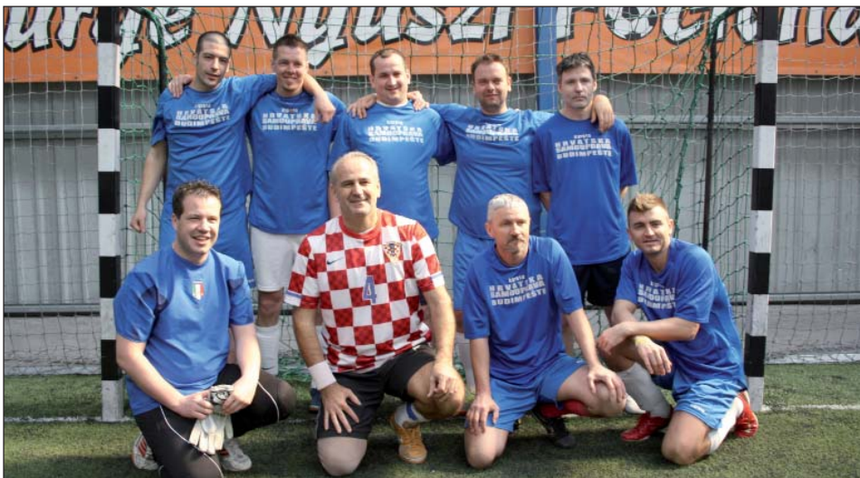
Momčad grada Budimpešte

U organizaciji Odbora za kulturu, vjerska pitanja, mladež i šport Skupštine Hrvatske državne samouprave, u subotu 24. ožujka, u baranjskome Mišljenu priređen je jubilarni, 5. hrvatski državni malonogometni kup.