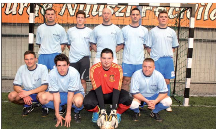
Momčad Jursko-mošonsko-šopronske županije-Koljnofa; osvajač 2. mjesta