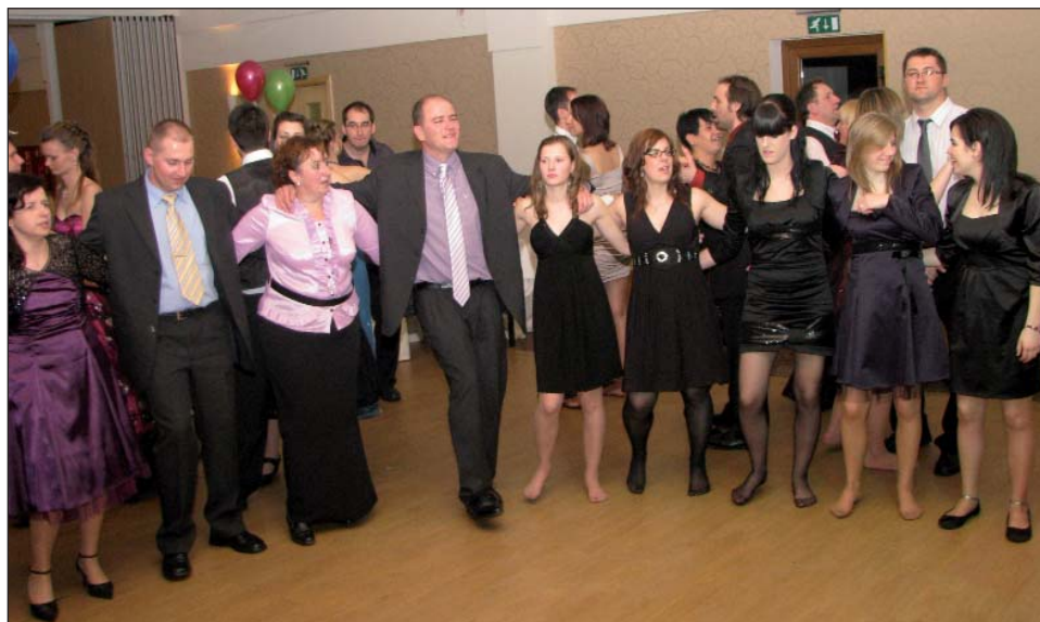
Ura, kad su se noge bolje ćutille prez potpetic