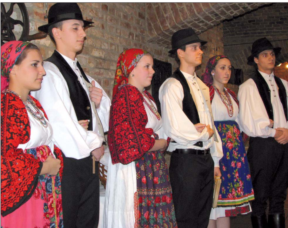
Plesači KUD-a Tanac

PEČUH – Savez mađarskih zborova, orkestara i narodnih sastava (KÓTA) organizira IV. Područno natjecanje južnog Zadunavlja za mađarske i narodnosne zborove i sastave, koje se održava u subotu, 5. ožujka od 9 i od 14 sati u domu kulture pečuškog Općeprosvjetnoga središta Apáczai. Nakon pozdravnoga govora predsjednika Skupštine Baranjske županije Zoltána Horvátha i prigodnoga kulturnog programa slijede nastupi na kvalifikacijsko nadmetanje prijavljenih zborova i sastava. U sklopu prvoga dijela, od 10 sati, među inima natječe se sastav KUD-a Ladislava Matuška iz Kukinja, pečuški ženski pjevački zbor Augusta Šenoae, hrvatski Trio „Jasen“ iz Pečuha, Orkestar Vizin također iz Pečuha i kukinjski Mješoviti pjevački zbor Ladislava Matuška, a u drugom dijelu, od 14 sati, mohački Tamburaški sastav „Poklade“ i Izvorni pjevački zbor iz Dušnoka. Nastupe pojedinih izvođača ocjenjuje četveročlano stručno povjerenstvo: dr. István Alföldy-Boruss, dirigent i ravnatelj Glazbenih sastava Mađarskoga radija; Ilona Budai, pjevačica narodnih pjesama i nositeljica priznanja „Za životno djelo“; Gábor Eredics, istraživač hrvatskih narodnih pjesama i voditelj sastava „Vujičić“, dr. Ferenc Várnai, istraživač mađarske i narodnosne glazbe te skladatelj s titulom „KÓTA“.