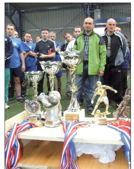
Mišljen 2010. godine