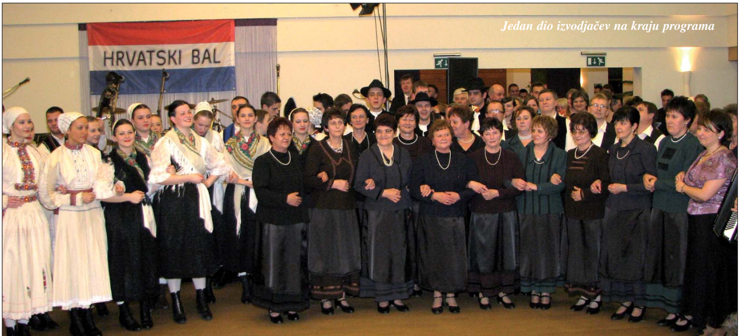
Jedan dio izvodjačev na kraju programa

Poznata lica davno vidjenih prijateljev, smih i veselje na svakom koraku. Perfektna organizacija, već od šesto gostov, velik broj časnih gostov iz političkoga i društvenoga žitka Hrvatov. Odlična mužika uz Petrovišćane s jako simpatičnim svirači Barunov, ukusna vičera, sadržajni razgovori, uski plac za tancanje, ali prijateljsko stiskanje ter luda zabava do bile zore. Ukratko tako bi mogli karakterizirati najveći, najelegantniji bal cijeloga Gradišća, i to u Sambotelu.