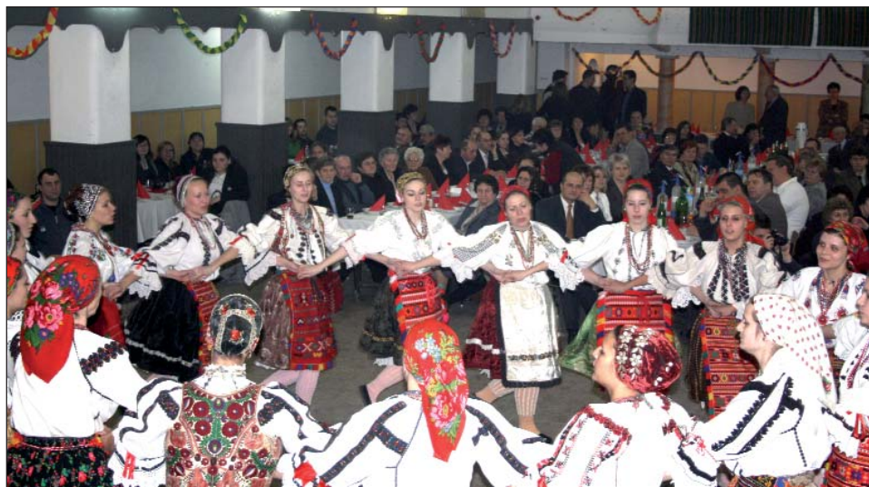
KUD „Tanac” iz Pečuha, dio gostiju

ciji, uređivanju i ukrašavanju dvorane, podpiranju nagradama za tombolu, pripremanju domaćih kolača i svemu drugome. Uza sredstva Hrvatske manjinske samouprave, priredba je ostvarena materijalnom potporom prijateljske Općine Petrijeveci i godišnjom potporom Samouprave sela Santova.