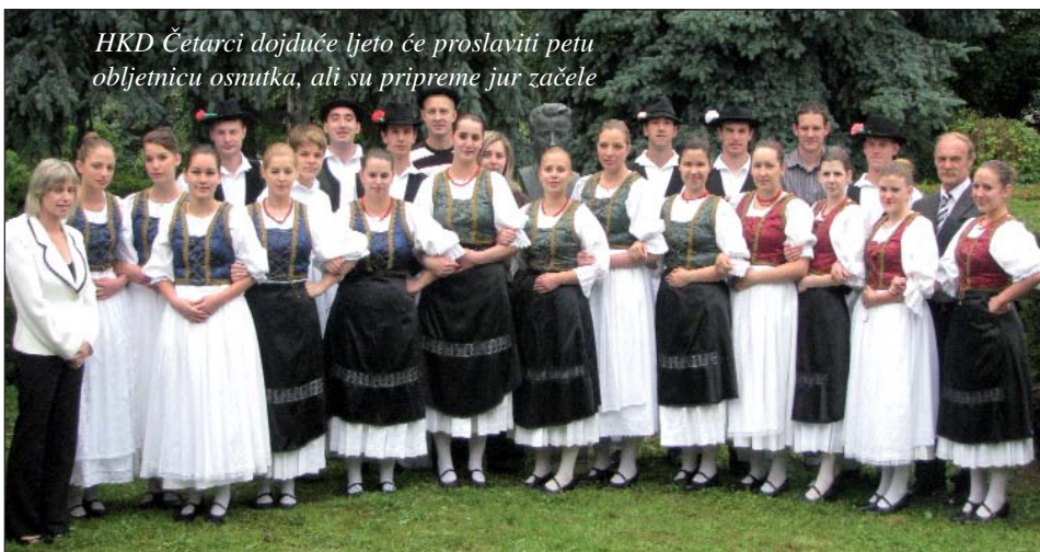
HKD Četarci dojduće ljeto će proslaviti petu obljetnicu osnutka, ali su pripreme jur začele

Volim te uvijek, čak i tada Kad ne volim te, kad si sama, Kad večer pada iznad grada, Volim te kad se praviš dama, Kad ne voliš me, kao sada, U tome i jest život naš, U svakom slučaju te volim, U svakom slučaju te volim.