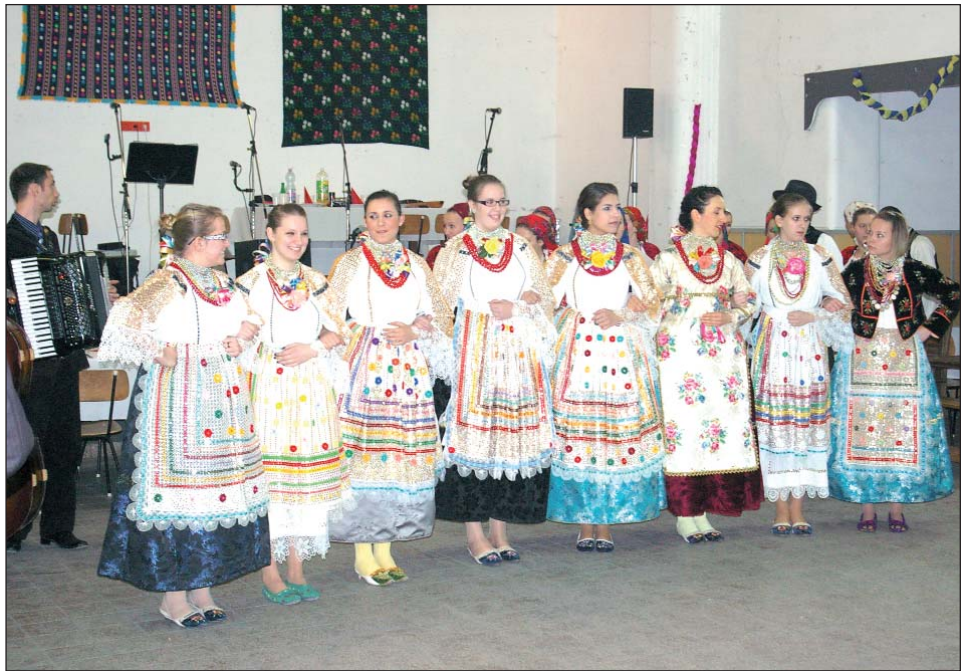
Samoorganizirane Santovkinje otvorile bal s pjesmom Marin, majko, lipo ime

Kao što je običaj još s kraja devetnaestoga stoljeća i preporodnih godina bačkih Hrvata, vezano za blagdan Svijećnice, 2. veljače, u Santovu se svake godine priređuje tradicionalni Marindanski šokački bal, i to po uzoru na prvo Veliko prelo održano 2. veljače 1879. godine u Subotici. Nekada se on održavao na sam blagdan, a već desetljećima priređuje se najbliže subote. Posrijedi je velika godišnja priredba koja je u gotovo svim našim bačkim naseljima u Mađarskoj do danas očuvala nekadašnje obilježje velikoga prela, prije svega da okupi, zabavi, ujedno da bude svojevrsna smotra narodne nošnje, glazbe, pjesme i plesa, a jednako tako i izraz nacionalne svi-