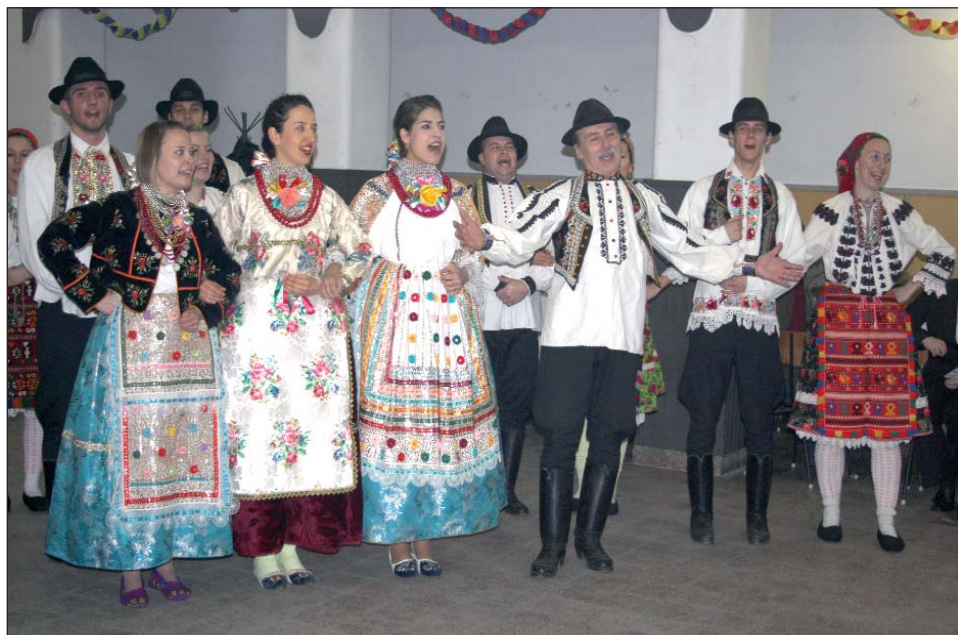
Domaćini i gosti – Vesela je Šokadija

PEČUH – Pokladna hrvatska večer priredit će se 4. ožujka u obnovljenom restoranu Slyven. Kako čitamo na plakatu s pozivom „Dobro došli”, osiguran je dalmatinski ili mediteranski ugođaj uz izvrsnu gastronomsku ponudu dalmatinskog podneblja o kojoj će se brinuti vrsni kuhari iz Hrvatske. Za program je zadužen KUD Tanac iz Pečuha, a za glazbeni ugođaj Orkestar Juice. Bit će priredena i videoprojekcija s naslovom „Dalmacija u slici i glazbi”.