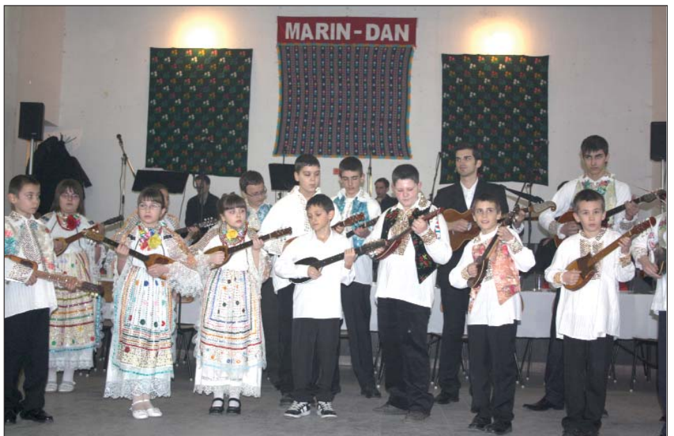
Tamburaški orkestar Hrvatske osnovne škole

Nastojanjima organizatora da okupi prije svega mjesnu hrvatsku zajednicu, ali i goste iz drugih naselja, te ugosti uzvanike i predstavnike prijateljske hrvatske općine iz Petrijevac, umnogome je pridonio bogat prigodni kulturni program, ali i pomoć brojnih mještana koji su uzeli velik udio u organiza-