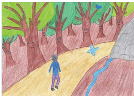
Dzsenifer Gracsek, 6. r.: Govorenje u jednini