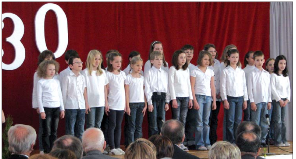
U svečanom programu su nastupila sva dica ka se uči i po hrvatski