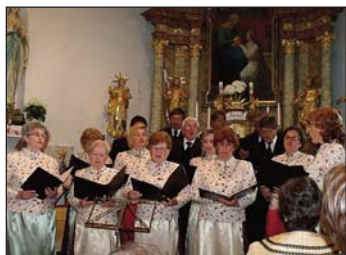
Rozmarin iz Gornjega Četara