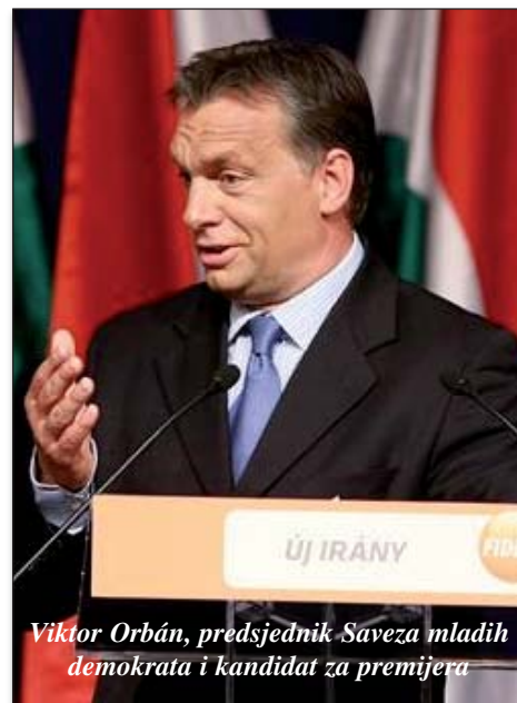
Viktor Orbán, predsjednik Saveza mladih demokrata i kandidat za premijera

U pojedinačnim biračkim okruzima FIDESZ-ovi kandidati već u prvom krugu ostvarili su isključivu pobjedu, osvojivši svih 119 mjesta od 176 mogućih, već u prvom krugu, a u preostalim 57, o kojima će se odlučavati u drugom krugu, čak u 56 okruga zauzeli su prvo mjesto. Procjenjuje se da je izgledna dvotrećinska većina FIDESZ–KDNP u novom sazivu Mađarskog parlamenta. Prema tome, od ukupno 386 mjesta FIDESZ–KDNP bi mogao osvojiti 260, MSZP 66, Jobbik 47 i LMP 13 mjesta.