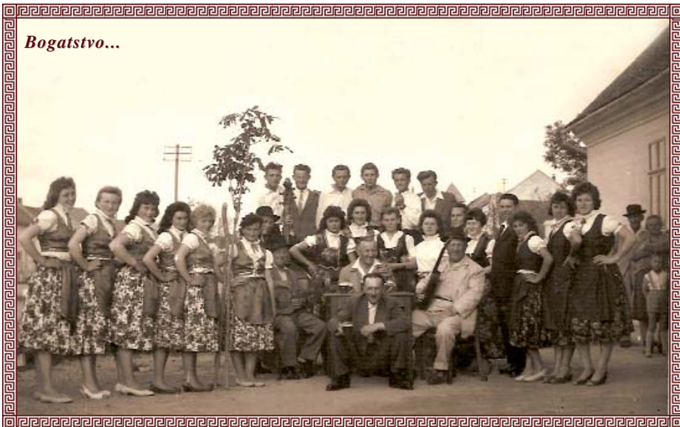
Kačmarci sredinom 20. stoljeća; Bunjevke i bača-lvušev tamburaški orkestar