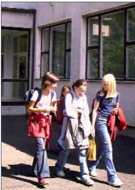
Kipic iz prošlosti židanske škole, kad su se dica učila još u velikoj školskoj zgradi