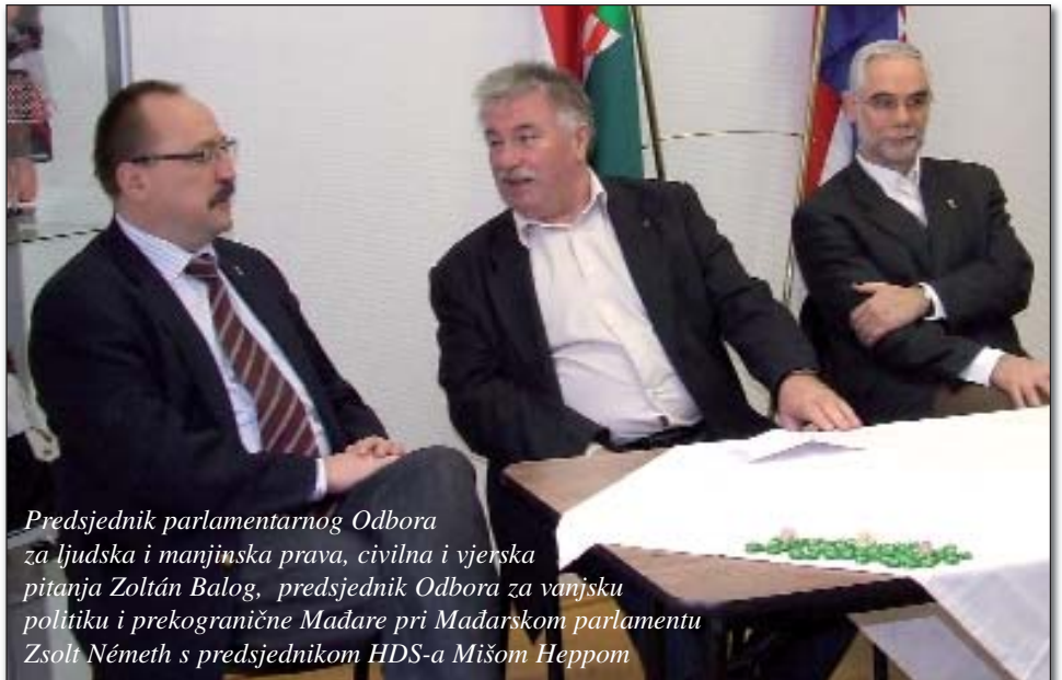
Predsjednik parlamentarnog Odbora za ljudska i manjinska prava, civilna i vjerska pitanja Zoltán Balog, predsjednik Odbora za vanjsku politiku i prekogranične Mađare pri Mađarskom parlamentu Zsolt Németh s predsjednikom HDS-a Mišom Heppom

Nakon riječi ravnatelja Horvatha predsjednik Samouprave g. Hepp predao je riječ Zoltánu Balogu, koji je zahvalio na pozivu te naglasio kako putem parlamentarnog Odbora postoji neka vrsta suradnje s hrvatskom zajednicom u Mađarskoj, ali su itekako važni osobni susreti. „Smatram da pitanje Hrvata u Mađarskoj nije samo unutarnje ili vanjskopolitičko, nego i nacionalno pitanje. Bitna je naša zajednička povijest i ako u Mađarskoj postoji jaka, čvrsta hrvatska zajednica, to je i za nas pohvalno” – reče predsjednik Balog. Budući da plan ustroja nove vlade nije za javnost, o tome nije govorio, ali je istaknuo kako se namjerava smanjiti broj parlamentarnih zastupnika i osigurati zastupstvo nacionalnih i etničkih manjina u narečenom tijelu. Skrenuo je pozornost da je lani utemeljen Forum nacionalnih i etničkih manjina u Mađarskoj, koji je ujedno i savjetodavno tijelo glede pitanja manjina, pa je primjerice zajednički izrađen obrazac za popis pučanstva. Potom se nazočnima obratio Zsolt Németh koji je naglasio kako su manjine u Mađarskoj uvidjele bit izgradnje kulturne autonomije i u današnjici se već može govoriti o mreži preuzetih ustanova u nadležnosti državnih samouprava. „Hrvate u Mađarskoj smatramo zajednicom pojedinaca koji su svjesni svoje narodnosne