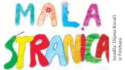
Izradila: Dijana Kovačić iz Fischeza