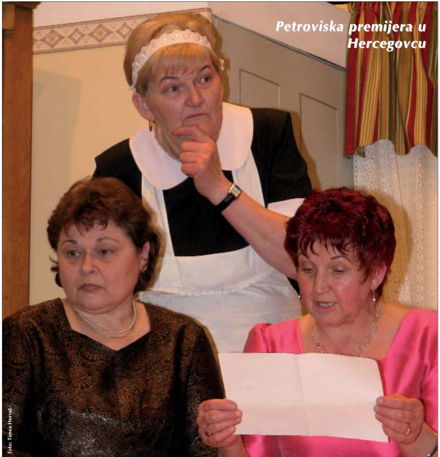
Petroviska premijera u Hercegovcu