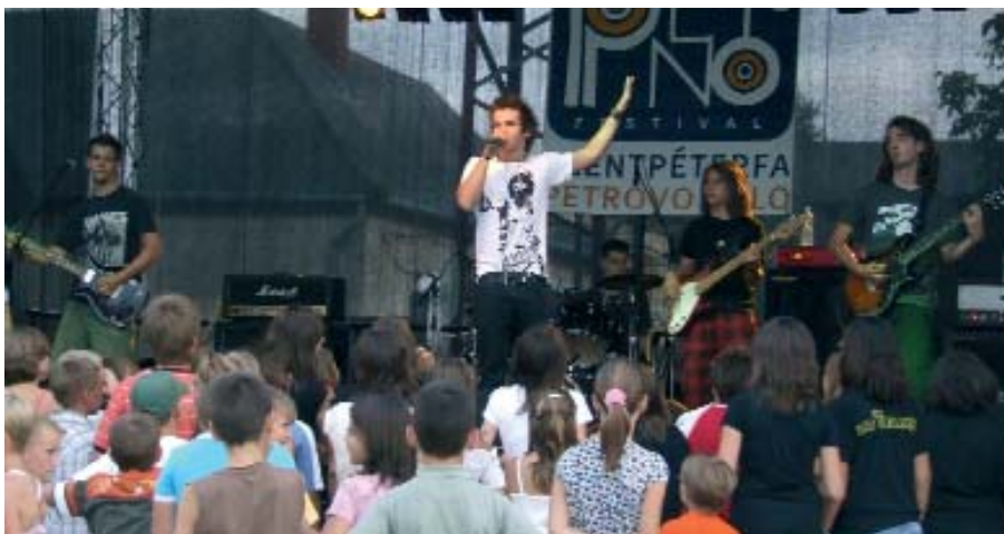
No Thanx je dao burni koncert