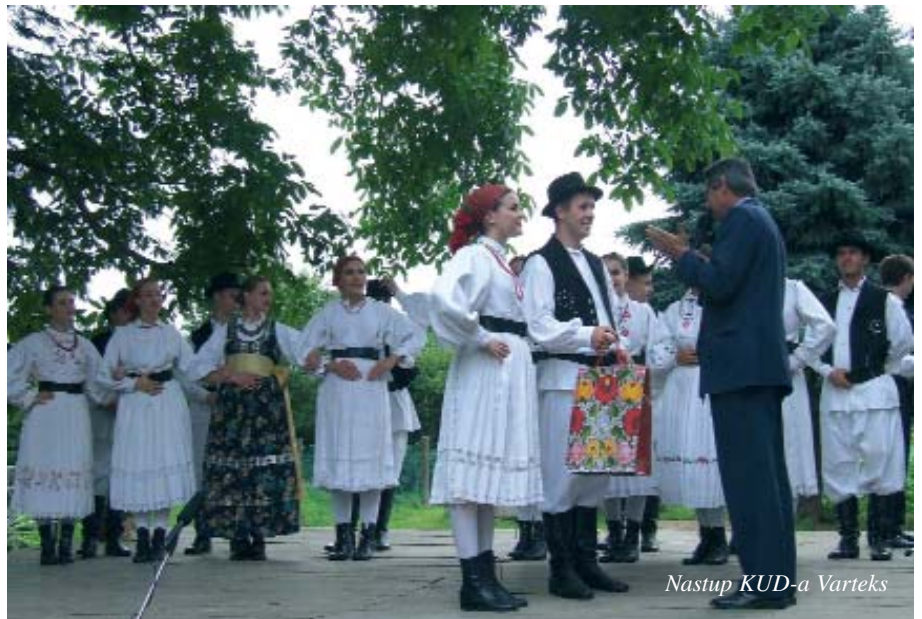
Nastup KUD-a Varteks