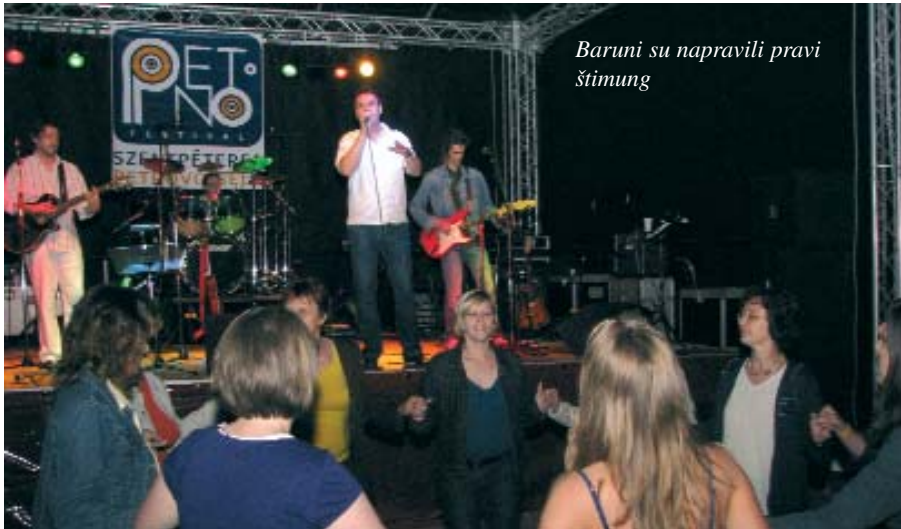
Baruni su napravili pravi štimung