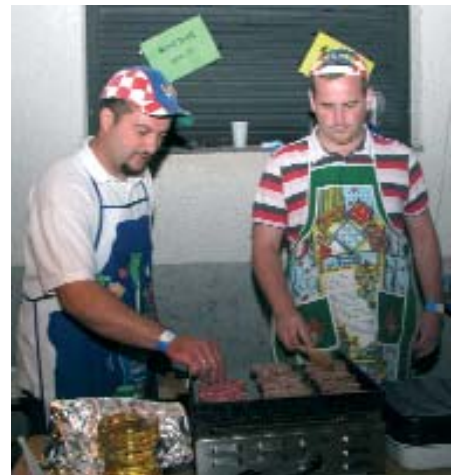
Dva dane dugo su se u ovoj djelaonici pekli čevapi