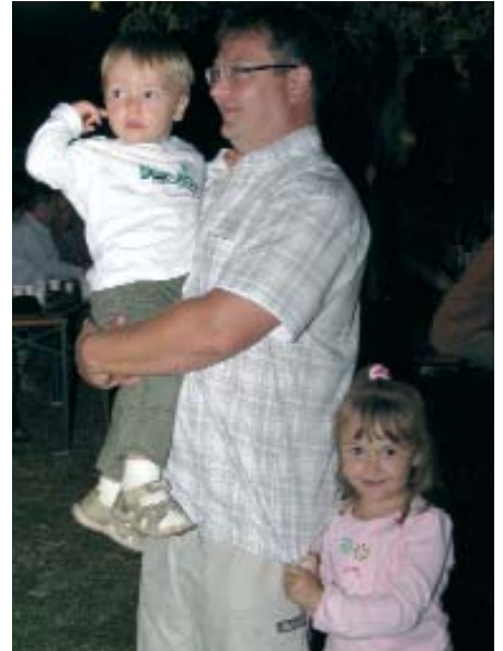
Najmladji obožavatelji Barunov

Prvo ljeto PETNO-festivala su dospili u Petrovo Selo tamburaški sastav Gazde, kot i Magazin. Predlani je kod nas gostovala Danijela Martinović, a lani je bio na vrhu dvodnevne manifestacije tamburaški bend Slavonske lole. Ljetos 5. julija, subotu, na petrovskoj bini izmjenično su nastupali kotrigi Barunov kot i Pinka-benda. Hrvatski gosti su zabavljali mnoštvo ljudi ne samo sa svojimi šlageri nek i s jačkami drugih izvođačev. Tako su „u duši“ med nami bili Mišo Kovač, Magazin, Bijelo Dugme, Vlado Kalember, Miroslav Škoro, Thompson, a naravno smo čuli i mogli uživati u cijelom repertoaru njegovih hitov iz prošlosti i sadašnjosti. Svojom otvorenošću, vidljivom voljom za muziciranje gradišćanskoj publici, od prvoga trenutka su pluli u simpatiji pjevač Danijel Banić i njegovi svirači. Prehladna noć je, međjutim, rano potirala domom publiku iako je čevap-djelaonica bila posipana s djelom sve do zore, kot i tancoši-konobari za šankom.