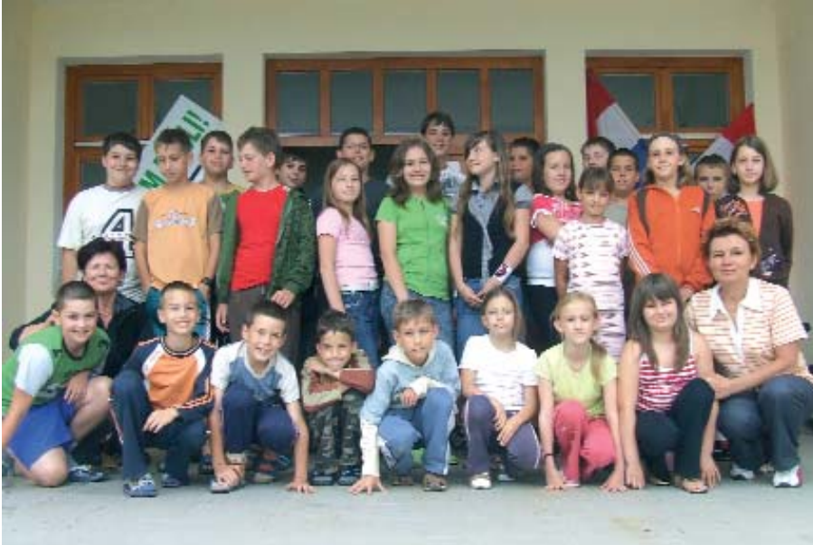
Sudionici pred ulazom u Fedakovu kuriju

Hrvatska manjinska samouprava u Kaniži i Letinji od 16. do 20 lipnja zajedno su priredile Hrvatski etnološki i jezični tabor u serdahelskoj Fedakovoj kuriji za djecu hrvatskoga podrijetla iz spomenutih pomurskih gradova. U taboru je sudjelovalo 18 djece iz Letinje, a 12 iz Kaniže.