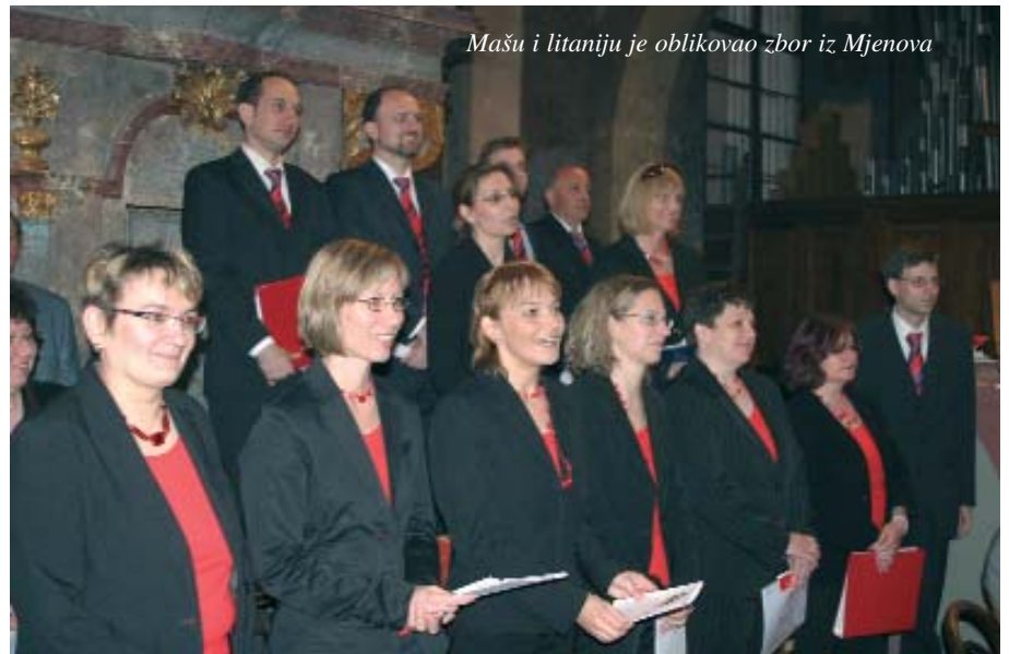
Mašu i litaniju je oblikovao zbor iz Mjenova