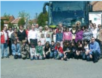
Skupna slika partnerov u Koljnofu

Pod geslom „Zajedno u Europi” su pred dvimi ljeti potpisali pismo namjere o suradnji na školskom i kulturnom polju Osnovna škola „Vukovina” Buševac, Osnovna škola „Mihovil Naković” Koljnof i Hrvatsko-gradišćansko kulturno društvo-Beč. U lanjskom školskom ljetu su dica predstavila svoje selo, okolicu i svoje ustanove na kulturnom programu i susretu u majušu u Koljnofu. Za ovo školsko ljetu su napravili infomapu kade su bila napišena zemljopisna, povijesna i općenita pitanja o Hrvatskoj, Austriji i Ugarskoj. Na temelju ove infomape je učiteljski tim napravio igru 1, 2 i 3. Svi sudionici su bili pozvani 18. aprila u Gradišćanskohrvatski centar u Beč, kade su mogli pred zmožnom publikom pokazati svoje znanje. U ime Centra je predsjednik mag. Tibor Jugović pozdravio nazočne i zaželjio dici i ovom projektu budućnost, veselje i puno uspjehov u njem. Gosti iz Buševca su bili smješćeni kod familijov u Koljnofu, a glavni organizator, Osnovna škola „Mihovil Naković”, im je još za cijeli vikend nudjala šalni i zanimljivi program. Koljnofska dica ćedu na jesen pohoditi partnersku školu u Buševcu, a za drugo ljetu ćedu se onde dogovoriti kot i za nastavak dotičnoga projekta.