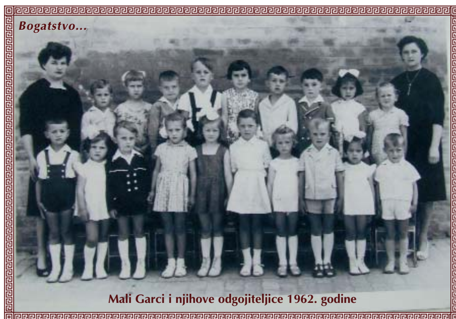
Mali Garci i njihove odgojiteljice 1962. godine