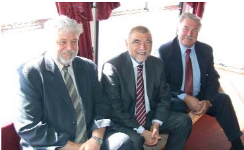
Za vrijeme vožnje Dunavom, prilikom svoga jednodnevnog posjeta Budimpešti, 9. svibnja, predsjednik Republike Hrvatske Stjepan Mesić zadržao se u razgovoru s predsjednikom HDS-a Mišom Heppom i predsjednikom Saveza Hrvata Josom Ostrogoncem