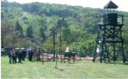
Gorica i Muzej „Željezni zastor” je atrakcija za svakoga posjetitelja