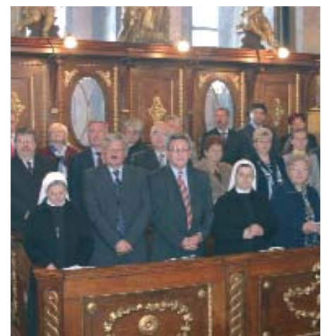
Mnoštvo hrvatskih vjernikov