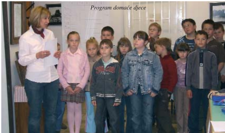
Program domaće djece

Približava se kraj školske godine, pa su školarci opet bogatiji novim saznanjima koja su usvojili tijekom nastave iz raznih predmeta. U pomorskim hrvatskim školama oduvijek je bila tradicija da se u svibnju organizira natjecanje za učenike iz raznih predmeta. Lani je još bilo pet škola čiji su se učenici mogli natjecati, no ove godine postoje zapravo samo dvije manjinske ustanove s podružnicama, pa su pedagozi u Mlinarcima odlučili da se ustroji kviz znanja i općeg obrazovanja za niže razrede, naime, niži razredi djeluju u Keresturu, Mlinarcima, Serdahelu i Sumartonu. Od prvog do četvrtog razreda po dvoje su se mogli natjecati, tako je na mjesto kviza, u Mlinarce, pristiglo 28 djece.