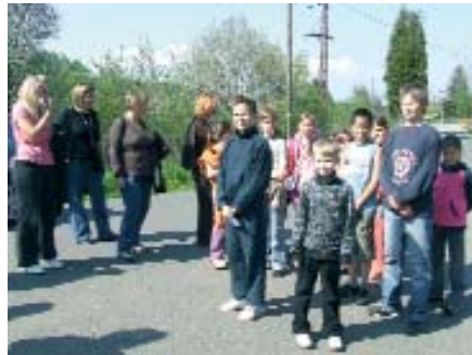
Dica su imala reli-ganjkov u četarskoj Gorici