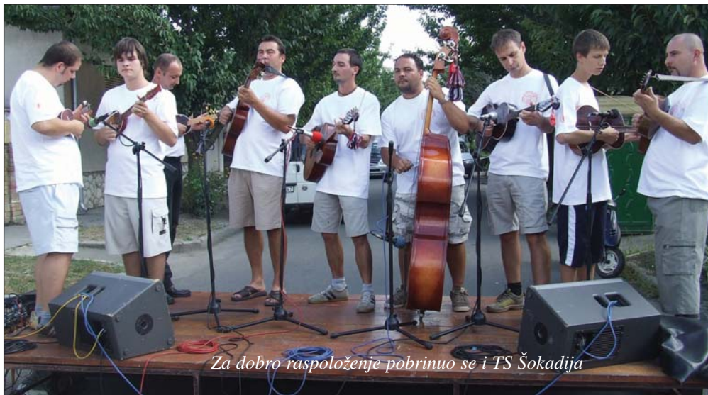
Za dobro raspoloženje pobrinuo se i TS Šokadija

Obavezno dođite u Mohač idućeg ljeta na XV. Grahijadu, jer ako ste već bili, zasigurno ste se dobro osjećali, a ako još niste, onda trebate otkriti dobru zabavu koju vam nudi, za obitelji i za prijateljska društva. S. L.