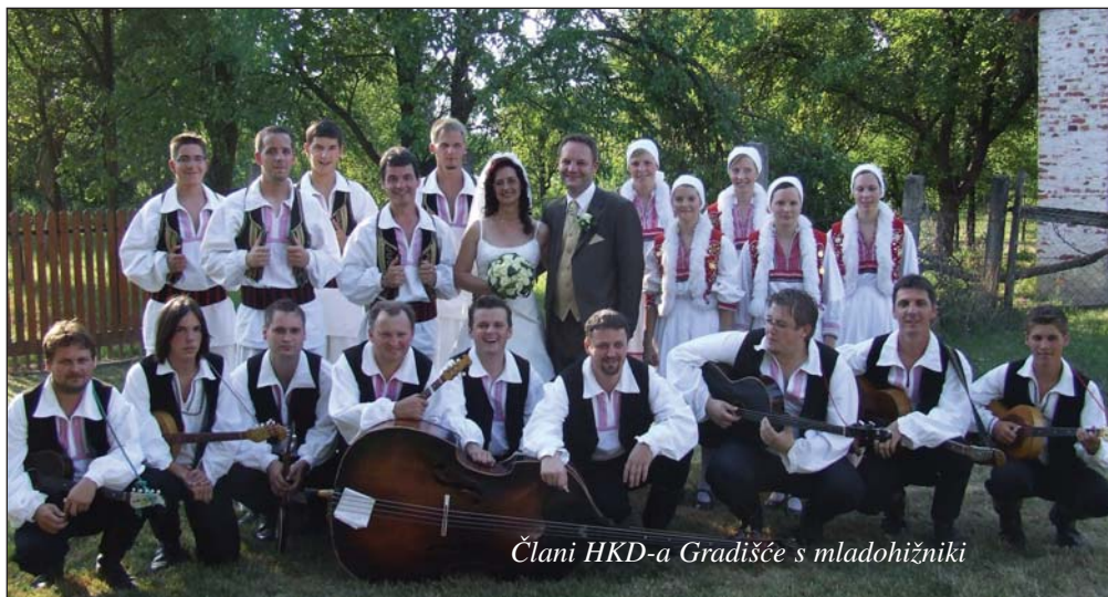
Člani HKD-a Gradišće s mladohižniki

Kad se udaje folkloristica HKD-a Gradišće