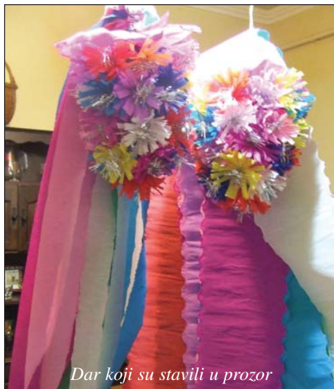
Dar koji su stavili u prozor

Nekoć su se u pomurskome kraju održavale svadbe većinom zimi, naime, tada još nije bilo hladnjaka ni zamrzivača da bi se moglo staviti u njih hrana. Promjenom vremena, modernizacijom i običaji su se promijenili. Vjenčanja se održavaju u toplije vrijeme, od kasnoga proljeća do rane jeseni, kako loše vremenske prilike ne bi smetale veselju. Nekada su se svadbe održavale gotovo tri dana, od prosidbe do ludovanja od petka do nedjelje, održavale su se u kući, pa je trebalo sve preurediti da stane mnogo gostiju, a nakon svadbe cijelu kuću obojiti zbog posljedica veselja. Danas je to jednostavnije i udobnije, treba unajmiti neki veći prostor, restoran ili dom kulture, gdje može stati mnogo ljudi, pa se lakše može veseliti.