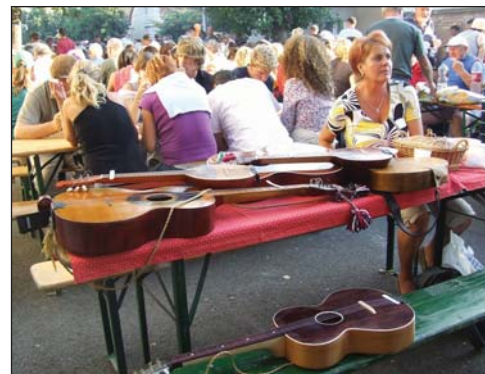
Dok su svirci večerali, tambure su se odmarale

Između 13 i 14 sati počelo je kuhanje, a iz