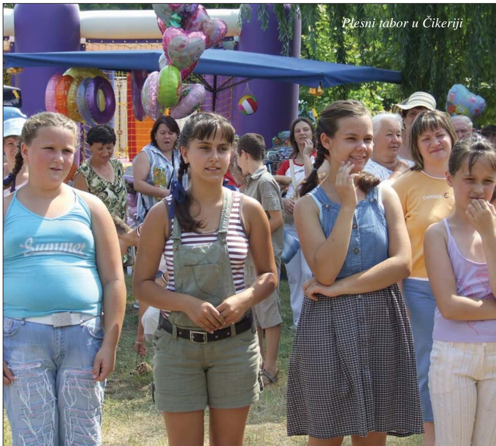
Plesni tabor u Čikeriji