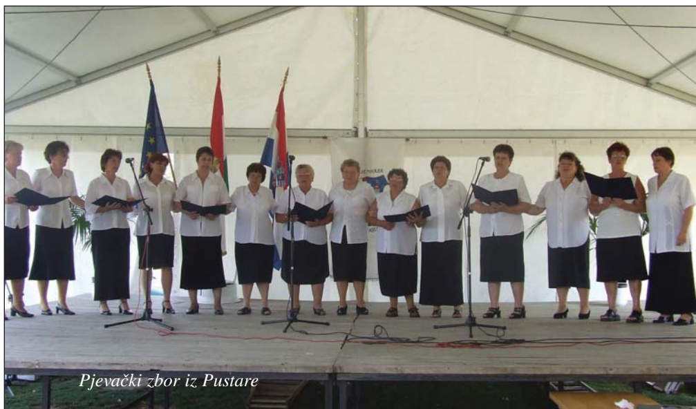
Pjevački zbor iz Pustare

– U malim segmentima možda možemo pružiti i materijalnu pomoć, ali ono što im treba HDS, to je moć informacije, pokušat ćemo preko svojih veza pomagati. Katkad su tu mala pitanja koja vode rješavanju većih problema. Važno je da se približimo u ljudskom segmentu i pokušamo jedan drugom pomoći za dobrobit Hrvata.