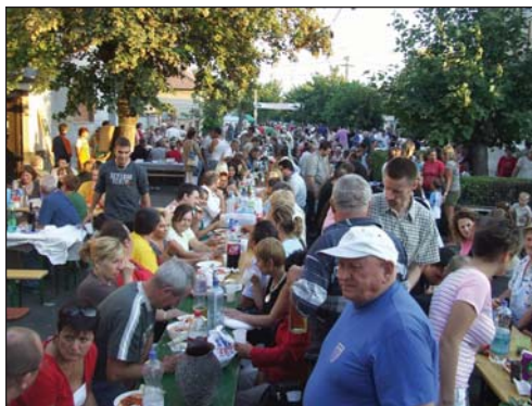
Oko 1500 ljudi zabavljalo se na ovogodišnjoj mohačkoj Grahijadi

Iz godine u godinu sve je više prijavljenih