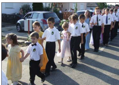
Duga je bila povorka ka je sprohodila zaručnicu i zaručnjaka do crikve

šnic i stačilov, kot i u narodnu nošnju obličeni tancoši, a tomu je bio razlog da je Hajnika većdesetljeća dugo član Hrvatskoga kulturnoga društva Gradišće . Uza to mnogo ljet je bila aktivna i na mjesnoj pozornici, kot kotrig igrokazačkoga društva, a ljetodan prlje smo još skupa prikazali Petrovisku svadbu na sceni. U domaćoj crikvi sv.