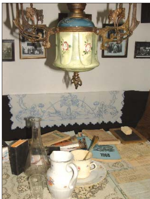
Lani je otvoren Seoski muzej, većinom s dugovanji iz Brigovićeve kolekcije

Selo je okruženo s tablicami sunčanih ruž