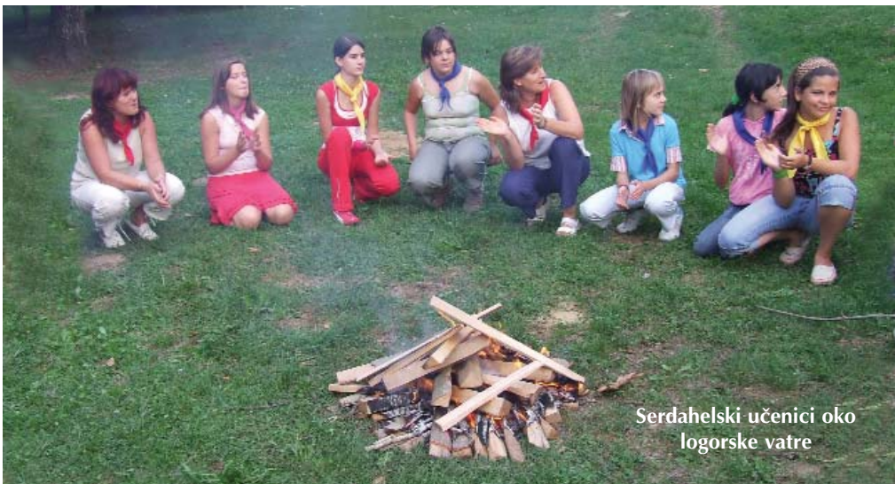
Serdahelski učenici oko logorske vatre