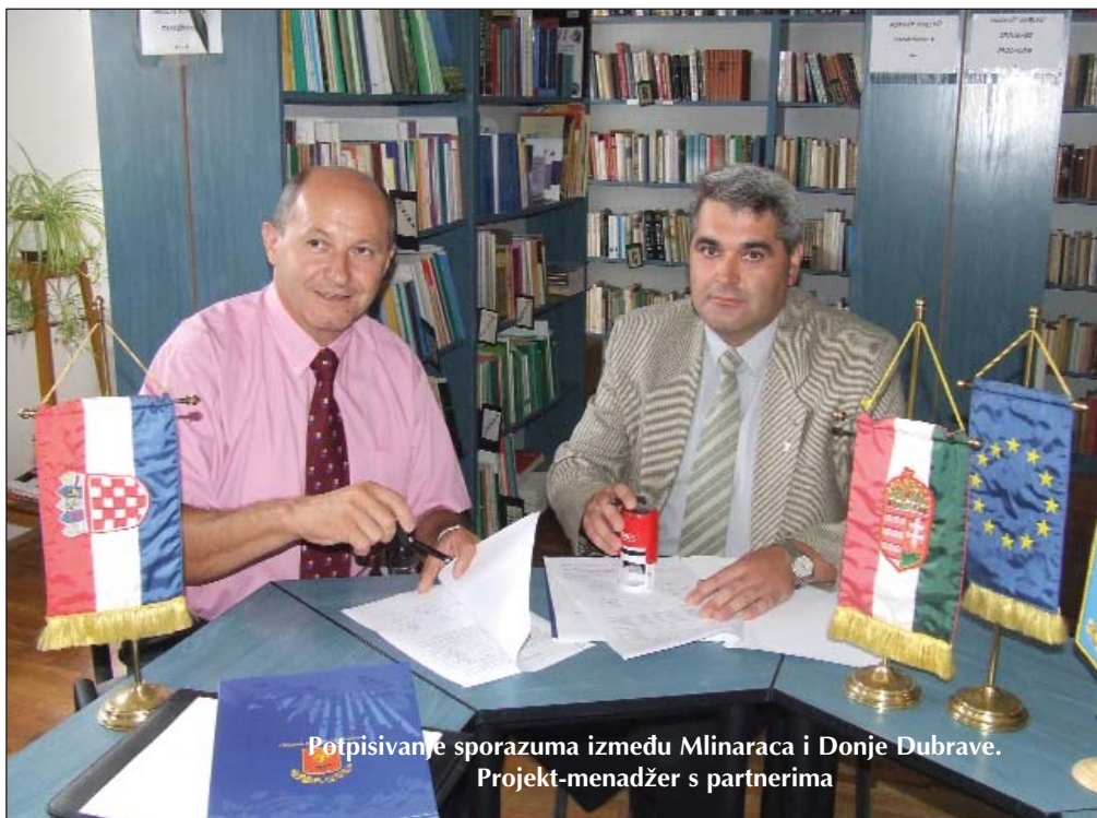
Potpisivanje sporazuma između Mlinaraca i Donje Dubrave. Projekt-menadžer s partnerima