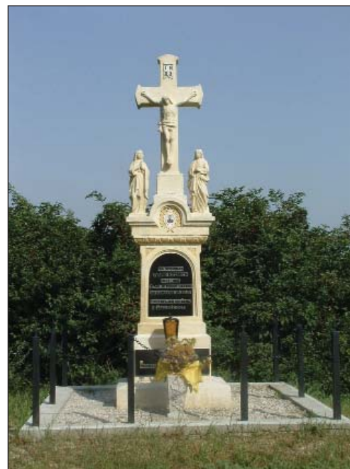
Pred ulazom u Plajgor se najde ov križ, na spomin pokojnoga vojnika

Peruške Marije u lugu bi se spočivali pak otud pohod do židanske crikve, muzeja Škoruš pak u Lukindrof. U Prisiki je takaj mnogo česa za viditi, od jezera začeto prik kaštelja do crikve. Ta krug sve skupa bi bio od 20-25 kilometarov, ufajmo se da će jur ovo ljeto komu to pasti napamet, u čarobnoj ponudi seoskoga turizma.