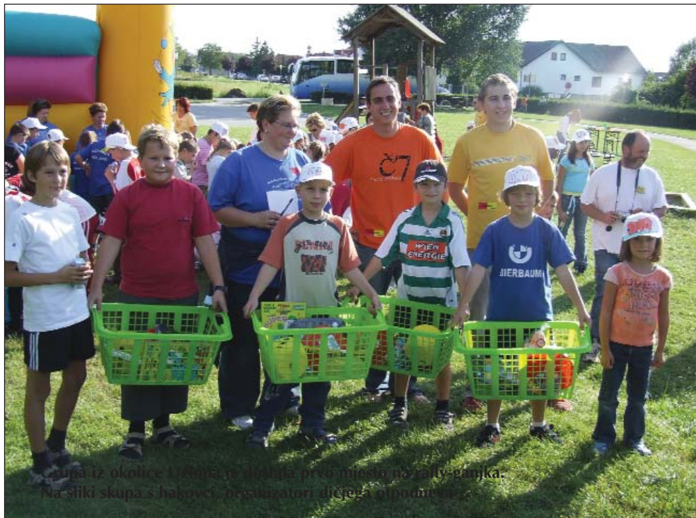
Putujući iz okolice Uzlopa, grupa je pronašla mnogo stvari na rally-ganjku. Na slici skupa s najmlađim organizatorima dičje-otpodne.