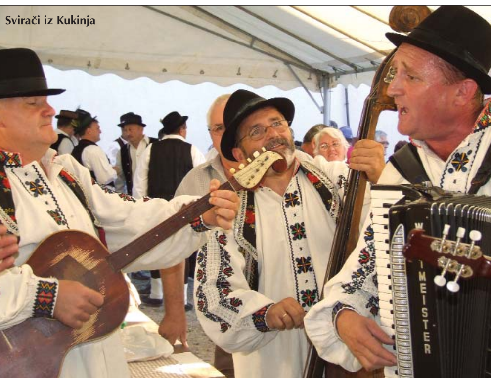
Svirai iz Kukinja