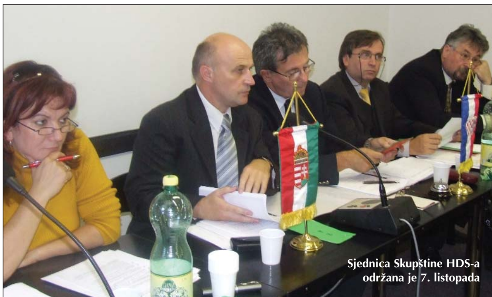
Sjednica Skupštine HDS-a održana je 7. listopada