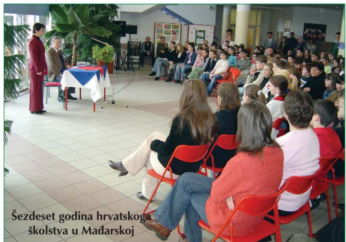
Šezdeset godina hrvatskoga školstva u Mađarskoj