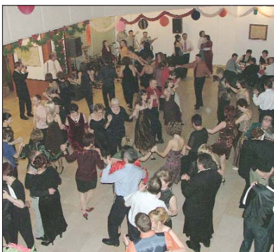
Do jutra se je tancalo