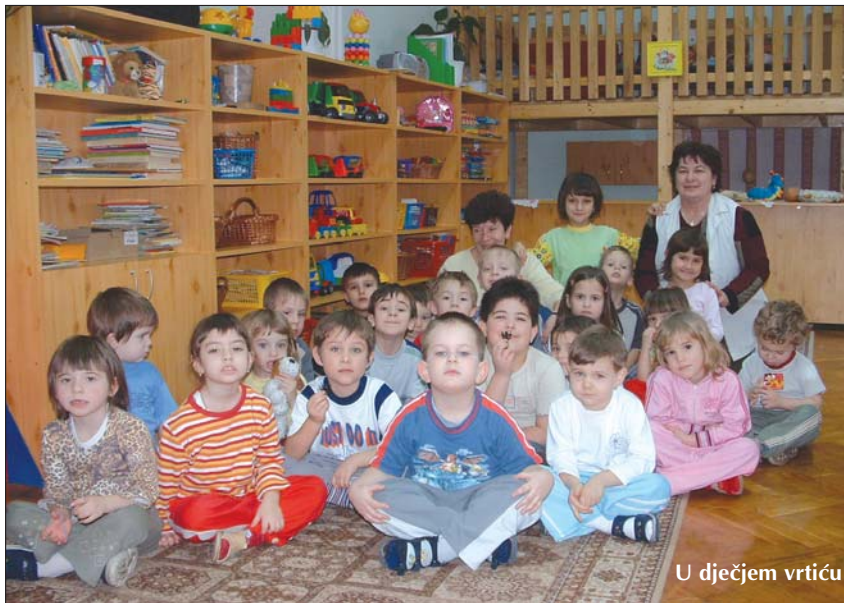
U dječjem vrtiću

Hrvatska državna samouprava razmotrila je hrvatske osnovne škole u koje bi se moglo uvesti učinkovitije podučavanje hrvatskoga jezika, tj. dvojezična nastava. U pomurskoj regiji podupirala je serdahelsku ustanovu.