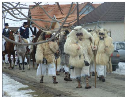
Buše su pohodile berečke ulice, na najveće veselje domaćinov