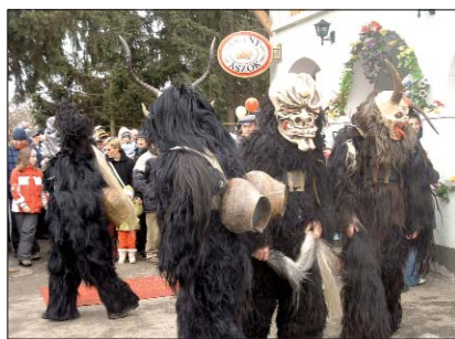
Strašna kavalkada mrskih stvorenj