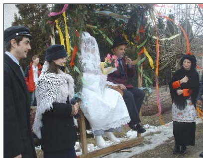
„Srični par” pred prisegom

izvikavanjem su zabavljali „svate”. Dokle smo zašli do centralne krčme, kade je bio priseg, mladoženja je nekoliko puta skrsnuo, ali na kraju se je spunila Božja volja i hižniki su se skupazeli. Hrast su izlicitirali i prodali za 22 jezero forintov, kupio ga je kermendski načelnik István Bebes ki je pak velikodušno ostavio drivo domaćinom. Za ceremonijom je nastavljeno mulatovanje u kulturnom domu, a mi smo u krčmi sjeli jur bez maskov s Mohačani. Pri tom smo doznali da u Mohaču se je moglo obličići za buše oko 600 mladičev, med njimi je kih 200 ugarskih simpatizerov, kot je i ova šaka došljakov. Povidali su i to da u Bereku je takaj jedan graničar ki je mogao svako ljeto otputovati na mohačku povorku kot buša i prik njega je sklopljeno ovo prijateljstvo. Jednoglasno su tvrdili da kļjetu pravoda dojdou i u Petrovo Selo, jer svaki trenutak toga ludovanja uživaju. Međjutim, to je dragi hobi, kada pratež stoji otprilike 300 jezero forintov, ali prelipa šokačka autentična oprava kvizno vridi pinez. Buše su toga dana umarširale i u športsku halu razveseliti navijače na košarkaškoj utakmici Kermend – Debrecen, kade, kako se čuje, takaj su imali zvanaredni uspjeh sa svojim maskami. No, prlje toga su zeli našu rič da ćemo je jednoč prođti pogledati na ophodu bušarov, zavolj česa smo u svakom mesopusu znamda i jalni/zavidni gradu Mohaču.