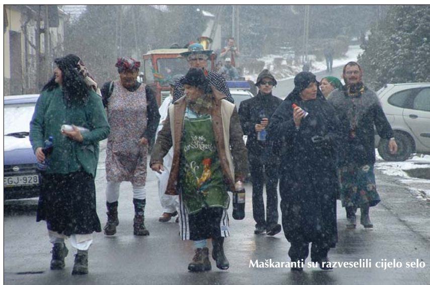
Maškaranti su razveselili cijelo selo

Zaman su hteli na kraj tirati, daleko odzganjati zadnjega fašenjskoga vikenda zimu u Koljnofu ter još i u brojni gradišćanski seli; razjadan, hladan vjetar je dalje fućkao svoju notu ter i snig s godinom u duetu nikako nij mario za ljudsku volju. Suprot mačehinskoga vrimenta Roditeljska zajednica koljnofske OŠ Mihovila Naković ni prominjala svoje plane za 25. februar, subotu, i pokrenula je na put svoje ljude. Med njimi su bili veseli mladi ter i iskusni aktivisti ki će vrijeda, kako se čuje, utemeljiti vlašće društvo iz tih selčanov ki se kanu u budućnosti još više zalagati za Koljnof. Ovako su prvi korak u jako dobar smir učinili kad su iz prošlosti maškaranti toga dana najzad donesli mesopusno upajanje i veselje ne samo na placi nego i u srca. „Ljudi, zbudite se!” se čulo, a i batika je roštala na metalu. Ciganice su polako došle u formu ter sve glasnije su iz šale prodavale rube, rublja, plastične ružice domaćinom, a