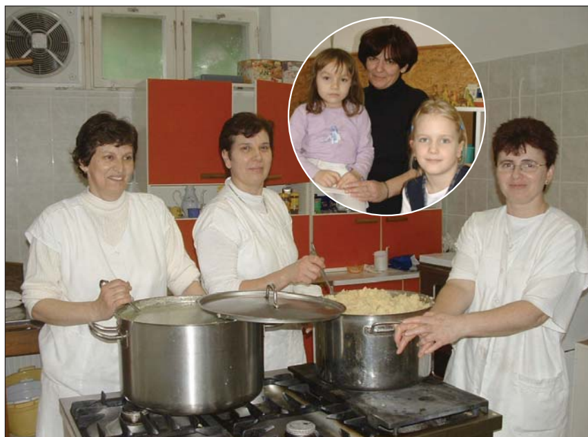
U kuhnji svaki dan kuhaju za 180 peršonov