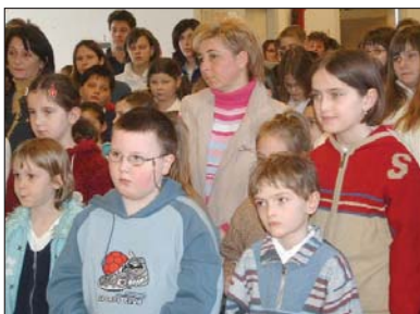
Sudionici regionalnog natjecanja u Mlinarcima

KERESTUR – Dobrovoljno vatrogasno društvo iz toga mjesta održava svoj tradicionalni bal 11. veljače u zgradi dječjeg vrtića, na koji poziva svoje kolege iz Kotoribe.