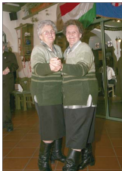
Najzrelije umočke tančoške dovidob su bile na svakom hrvatskom balu u Hečki