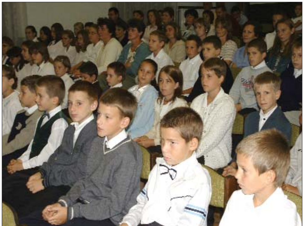
Dica petroviske Dvojezične škole