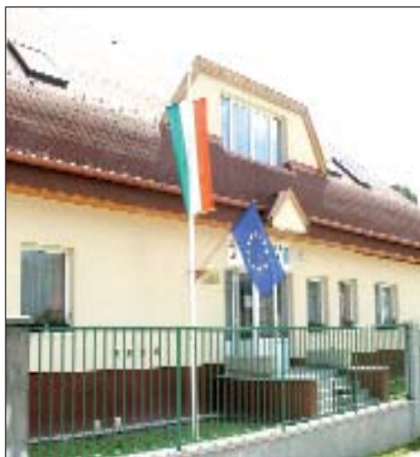
Prelipa školska zgrada u Kemlji