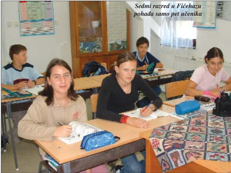
Sedmi razred u Fičehazu pohađa samo pet učenika

Prvoga rujna otvorila su se vrata osnovnih i srednjih škola diljem naše zemlje, što za školarce, nastavnike, profesore znači početak još jedne školske godine s mnogo rada, strpljenja, problema, veselja i drugih iskustava. Svaka školska godina donosi nešto novo, mijenjaju se programi, učenici i nastavnici, uvedu se nove knjige ili kružoci, a štošta se i ukine. Upravo ta promjena za učenike i djelatnike ustanova znači nove izazove, no stvara i napetosti.