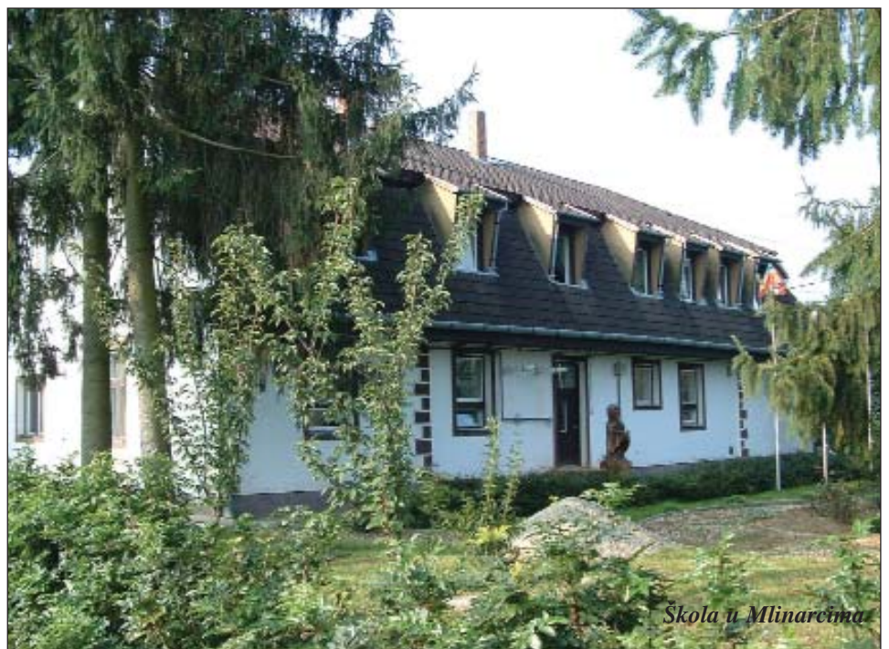
Škola u Mlinarcima

Mlinaračku školu pohađa 150 djece osnovne i strukovne škole u kojima se podučava hrvatski jezik četiri sata tjedno. Ustanova ima novoga ravnatelja. Po zavr-