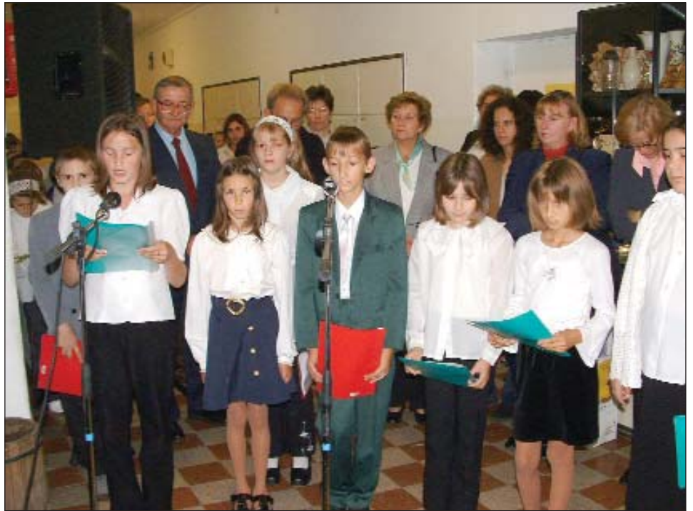
Keresturska škola ima najorganiziraniju suradnju s hrvatskom školom preko granice

U dječjem vrtiću, gdje je po neslužbenim informacijama trebalo započeti jedno-